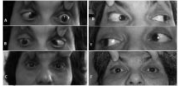
Şekil 1: Ameliyat öncesi bilateral abducens sinir paralizisi (A, B ve C) ve ameliyat sonrası (D, E ve F).

görüldü. Bilateral abducens sinir paralizisi mevcuttu (Şekil 1A, B, C). Motor veya duyuşsal kayıp yoktu. Rutin laboratuvar testleri normaldi. Kranial magnetik rezonans görüntüleme (MRG) nöropatoloji izlenmedi. Beyin omurilik sıvısı (BOS) ksantokromik olup BOS basıncı 20cmH 2 O elde edildi. BOS gram boyama, kültür sonuçları negative idi. Acil planlanan dijital substraksiyon anjiyografide (DSA) 7mm sağda ve 10mm solda orta serebral arterde (OSA) sakkuler anevrizma izlendi (Şekil 2).