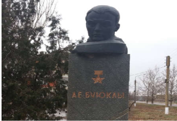
Vladimirovka köyündeki "Buyukly" Anıtı

Dimitrovka köyünde 100 yaşında bir Gagauz yaşlısıyla konuştuk. Konuştuğumuz bu yaşlı kadın Gagauz kendisine yönelttiğimiz "Hangi dil laf edeysin" sorusuna "Bulgarca" şekilde cevaplamıştır. "Bulgarlar başka konuşuyor" dediğimizde, bize "Onlar başka Bulgarca konuşuyor." Cevabını vermiştir. Bu örnekte görüldüğü üzere Gagauzlar maalesef kendilerini Bulgar etnosu içinde değerlendirmişler ve şimdi de değerlendiriyorlar.