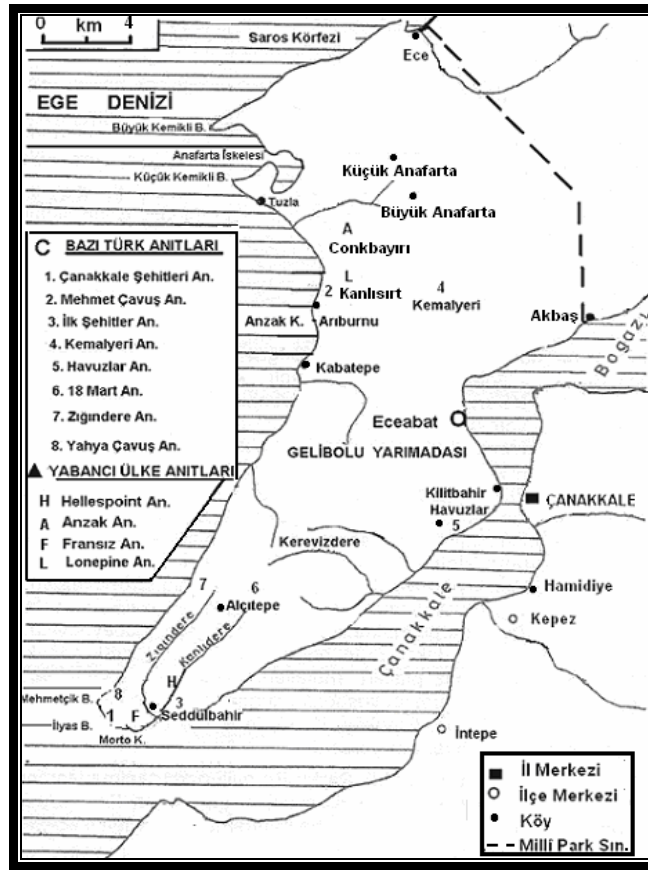
Şekil 2. Gelibolu Yarımadası Tarihi Millî Parkı'ndaki Önemli Anıtlar ve Muharebe Alanları.

lerce uzanan siperler, batık gemi ve askerî mühimmat kalıntıları, farklı uluslara mensup askerlerin mezarları, efsaneler ve hikâyeler bunlardan bazılarıdır. Ayrıca yarımada üzerinde Osmanlı Devleti döneminden kalma kaleler, antik kent kalıntıları ve Gelibolu Mevlevihânesi gibi tarihî ve kültürel yapıtlar da bulunmaktadır (Şekil 2).