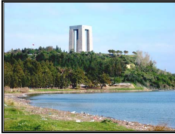
Fotoğraf 1. Çanakkale Şehitleri Anıtı'nın Morto Koyundan Görünümü.