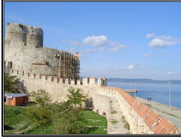
Fotoğraf 5. Osmanlı Dönemi'nden Kalma Önemli Bir Mimarî Yapıt: Kilitbahir Kalesi.

Sultan V. Mehmet döneminde inşa edilen ve içerisinde İlk Şehitler Anıtı'nın bulunduğu Seddülbahir Kalesi (Kale-i Sultaniye), Osmanlı Devleti döneminden kalan diğer bir kaledir. Ayrıca Osmanlı Devleti'nin Rumeli'de ilk fethettiği yerlerden biri olan Çimpe kalesi de yine Gelibolu yakınlarında bulunmaktadır.