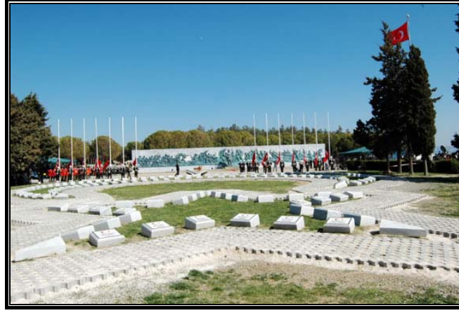
Fotoğraf 3. Çanakkale Şehitleri Anıtı Platform Alanından Bir Görünüm.

Hellespoint Anıtı: Yarımadanın uç kısmı, yani Seddülbahir ve çevresi Avrupalılar tarafından Hellespoint olarak adlandırılmaktadır. Anıt, muharebelerde İngiltere adına savaşa katılan ve ölen 18985 İngiliz, 248 Avustralyalı ve 1530 Hintli asker anısına dikilmiştir. 29. Kraliyet deniz Tümeni'nin ilk olarak karaya çıktığı Teke koyuna bakan Gözcübaba tepe üzerinde bulunmaktadır.