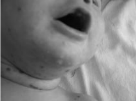
Resim 1: Yüz, çene ve boyundaki lezyonların görünümü.

tanısı kondu. Tedavide intravenöz immunoglobulin (1 g/kg/gün, iki gün) kullanıldı. İntravenöz immunoglobulin tedavisine ait herhangi bir yan etki ile karşılaşmadı. Tüm lezyonlar tedavi bitiminden sonraki üç gün içinde tamamen iyileşti. Hasta bir yıldır herhangi bir tekrarlama görülmezsizin takip edilmektedir.