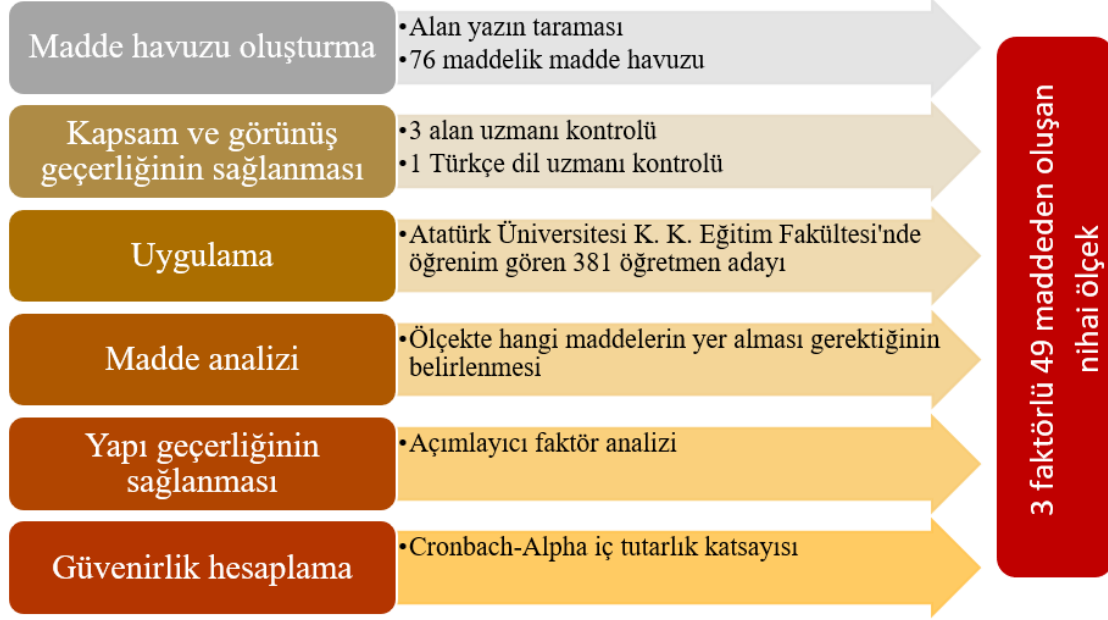
Şekil 1. Araştırmanın uygulama aşamaları Figure 1. Application stages of the research

lanarak ölçeğe son şekli verilmiştir. Araştırmanın uygulama aşamaları Şekil 1'de özetlenmiştir.