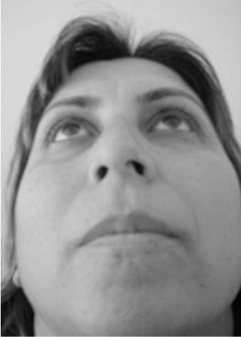
Resim 3. Hastanın operasyon öncesi bazal.