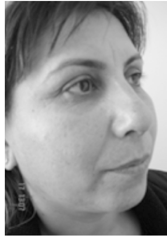
Resim 6. Hastanın postoperatif 2. hafta sağ oblik.

Septum deviasyonu ve sağ alar valv açısı yetmezliği tanıları ile septoplasti ve sağ alar kartilajın kıkırdak ile desteklenmesi planlandı. Hasta burnunda estetik yönden de değişiklikler yapılmasını istediği için hastaya açık teknik septorinoplasti ameliyatı yapıldı. Septoplasti sonrası Goodman insizyonu yapılarak nazal dorsum cildi eleve edildi. Hastanın cilt ve ciltaltı dokusunun oldukça kalın olduğu görüldü. Sağ alar kıkırdak medial krus ve lateral krusun total olarak olmadığı görüldü (Resim 4). Septal kıkırdaktan alınan kıkırdak ile kolumellar strut greft kondu. Yine septal kıkırdak grefti ile sağ lateral krus oluşturuldu. Tip üzerine dikdörtgen şeklinde cap greft dikildi. Yeterli kozmetik ve fonksiyonel sonuç elde edildi. Hastadan "bilgilendirilmiş olur" alınmıştır. (Resim 5,6,7).