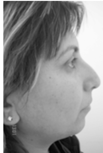
Resim 1. Hastanın operasyon öncesi sağ yan.

nazal travma veya nazal vestibül enfeksiyonu öyküsü yoktu. Kulak burnun boğaz muayenesinde anterior rinoskopide septum altta sağa deviyeye, nostriller asimetrik, sağ nazal valv açısı dardı. Derin inspirasyonda sağ alar kanat burnun içine retrakte oluyor ve nazal valv açısını daraltıyordu. Sağ alar rim sol tarafa göre retrakte idi (Resim 1,2,3). Dudak ve damak yarığı yoktu. Daha önce herhangi bir ameliyat geçirmemişti. Mandibula ve maksilla gelişimi normaldi. Bilinen bir sistemik hastalığı yoktu.