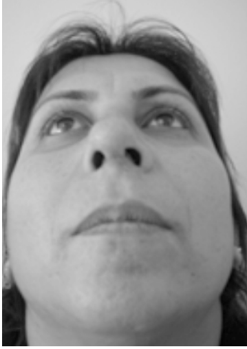
Resim 7. Hastanın postoperatif 2. hafta bazal.