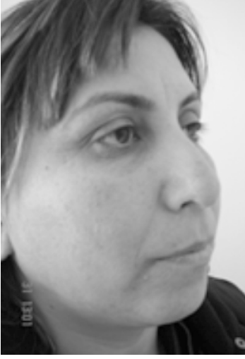
Resim 2. Hastanın operasyon öncesi sağ oblik.