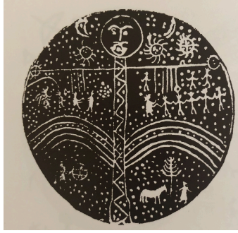
Resim1: Altay Davulu

Ritüel gerçekleştirecek olan şamanın yurtunun içinde ve önünde bu ağacın benzerleri ya da temsilcileri bulunmaktadır. Ritüel sırasında kayın ağacına tırmanan şaman, aslında Kozmik Ağaca tırmanarak, yeryüzüne seyahat etmektedir. kozmik ağaç, yeryüzünün tam ortasında yerden yükselmekte ve dalları göğün en üst katmanında oturan Bay Ülgen'in sarayına kadar ulaşmaktadır.