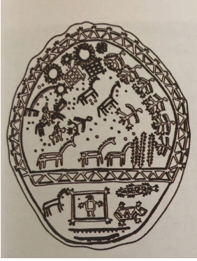
Resim 3: Güneş- Ay – Dünya ağacı

Ritüelde kullanılan davulların iç ve dış kesimlerinde gizemli resimler yer almaktadır. Bunlar süslemeler değil, anlamlı işaretlerdir ve şaman kültürünün dünya görüşünü tasvir etmektedirler. Boyanmış işaretler arasında en önemlileri güneş, ay ve dünya ağacı resimleridir. Bu ağaç dünyanın ortasını işaretlemektedir.