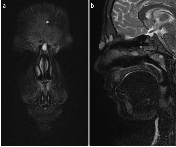
Resim 1. a, b. Koronal (a) ve sagittal (b) kesitlerde nasaldorsumda mevcut dermoid kist görüntüsü. İntrakranial uzanım izlenmemekte