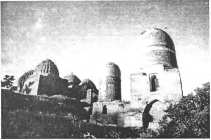
Resim 1- (yukarda) Şah-ı Zinde'ye girince solda Kadızâde Rumî'nin uzun boyunlu zarif türbesi ziyaretçileri salamlar.