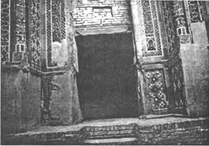
Resim 3-Türbelerin girişleri şu anda aslına uygun olarak onarılmaktadır.