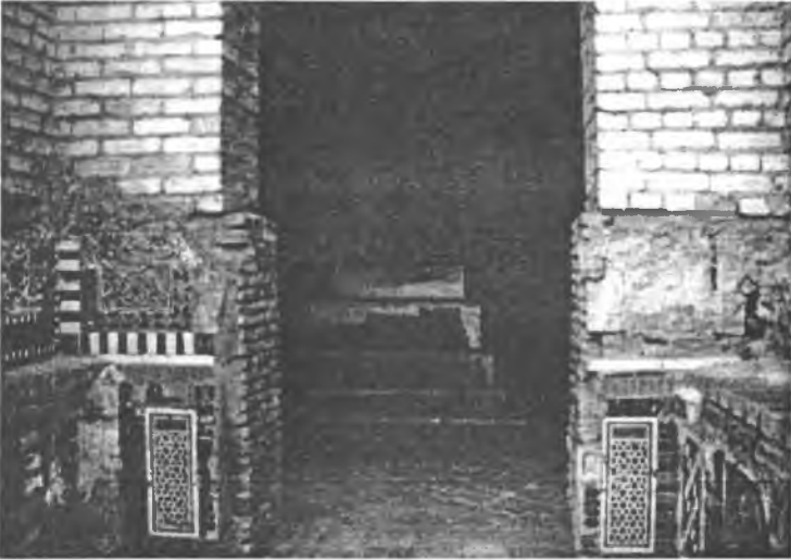
Resim 4- Bir sultanın sandukası. Üst üste konulmuş üç çini sanduka (mük'ab) gölgeli sokaklardan geçen ziyaretçilere hüznüyle bakmaktadır.