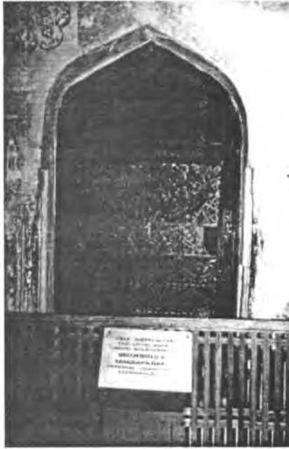
Resim 2- (solda) Kussem İbn Abbas, iç içe iki mescid mekânından geçilerek varılan bir türbe mekânında dinlenmektedir.