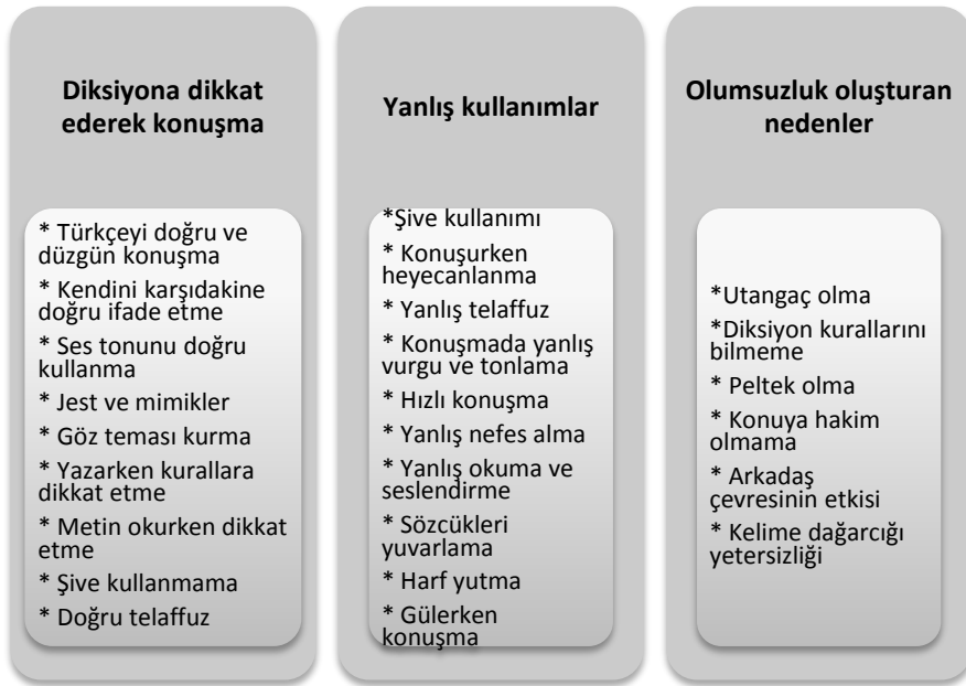
Şekil 3. Özdeğerlendirme Teması

Öğretmen adaylarına üçüncü soru olarak “Konuşurken ya da okurken, kendi diksiyonunuz konusunda ne düşünüyorsunuz? (Diksiyon açısından kendinizin olumlu ya da eksik yönleri sizce nelerdir?) sorusu yöneltilmiştir. Öğretmen adaylarının kendilerini değerlendirmelerine ilişkin görüşleri Şekil 3’te belirtilmiştir.