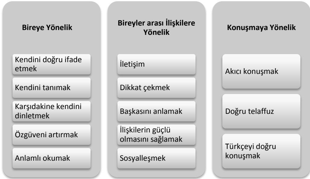
Şekil 1. Diksiyonun Önemine İlişkin Alt Temalar

Öğretmen adaylarının diksiyonun önemine ilişkin görüşlerini belirlemek amacı ile “Sizce diksiyonun önemi nedir?” sorusu yöneltilmiştir. Diksiyonun önemi temasına ilişkin 3 alt tema ortaya çıkmıştır. Bu alt temalar Şekil 1’de gösterilmiştir.