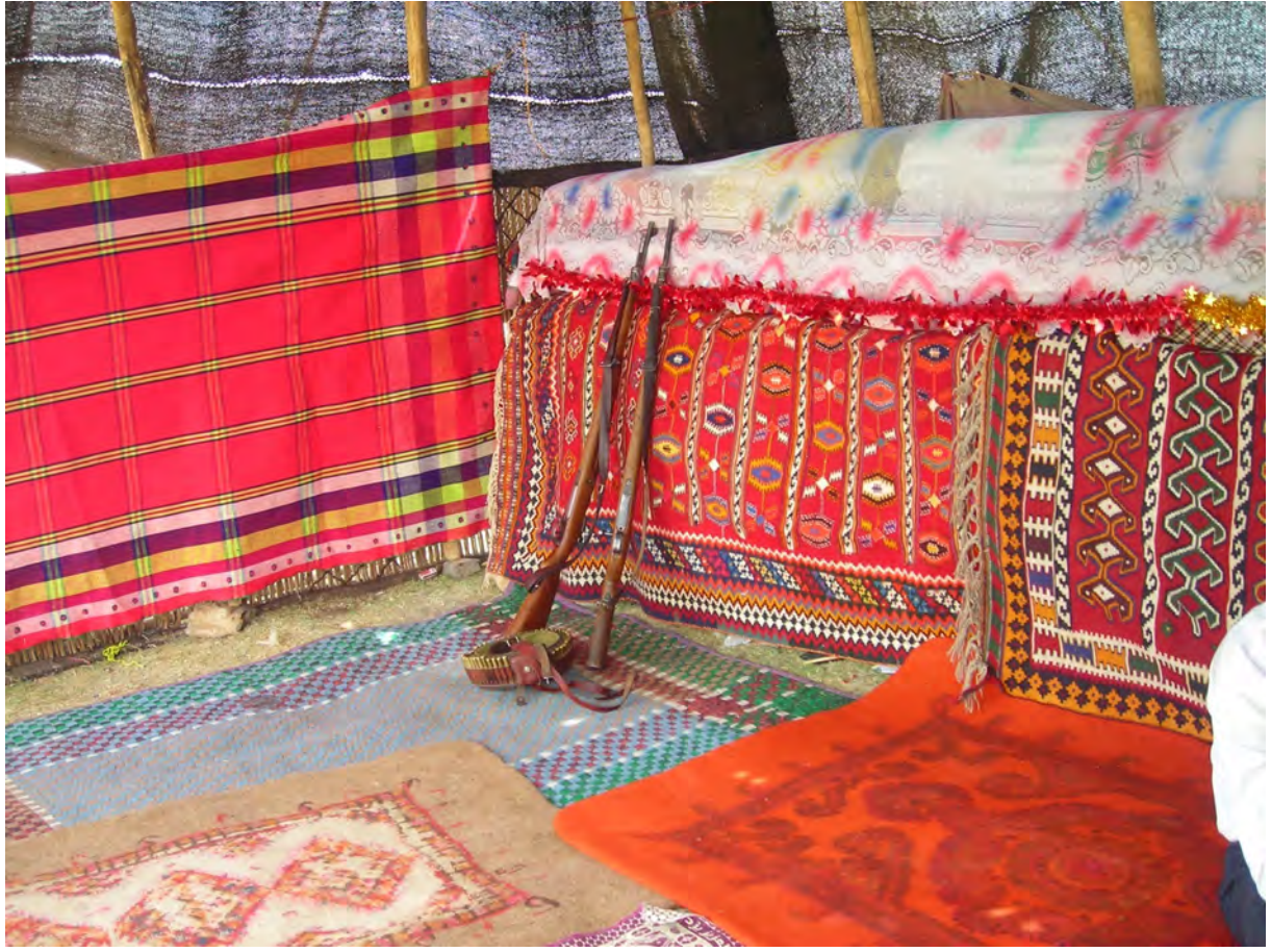
Mervdeşt, Sehad-i Çahardange-Şiraz- 2008