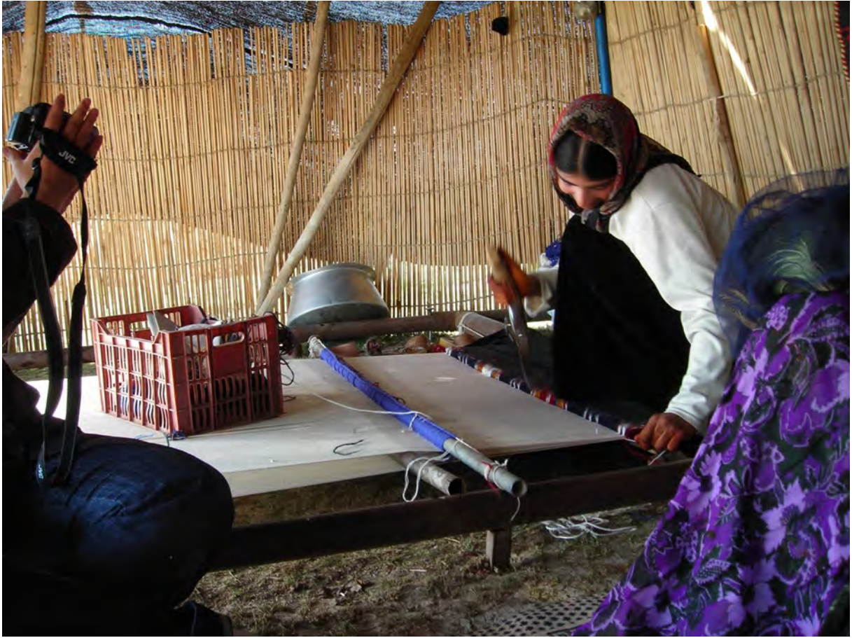
Fars Eyaletinin kuzey bölgesi, Serhad-i Çahar Dange-Asopas -2007