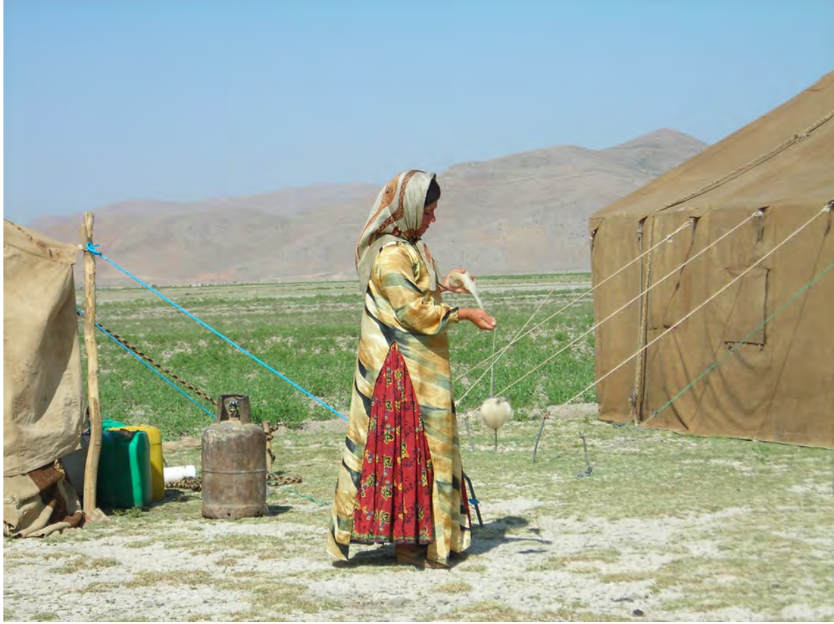
Fars Eyaletinin kuzey bölgesi, Serhad-i Çahar Dange-Asopas -2007

Arapça-Farsça birleşik sözlerin diğer birleşik sözlere göre fazla sayıda olması Farsçanın Arapçadan aldığı sözlerle oluşturduğu birleşik adlardan kaynaklanmaktadır.