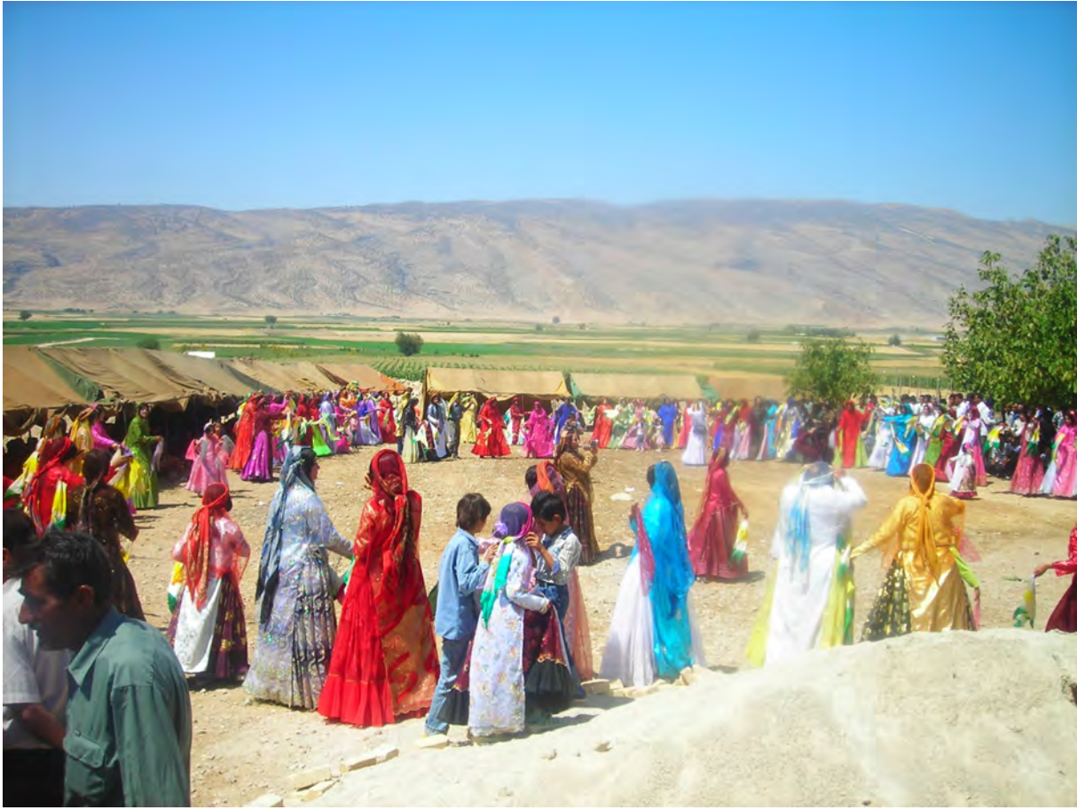
Düğün. Siyah Darengun Bölgesi, Kaleçubi Köyü-Şiraz-2008

Kaşkay Türkleri, Kaşkay Türkçesi, Türkçe, söz varlığı, adlar