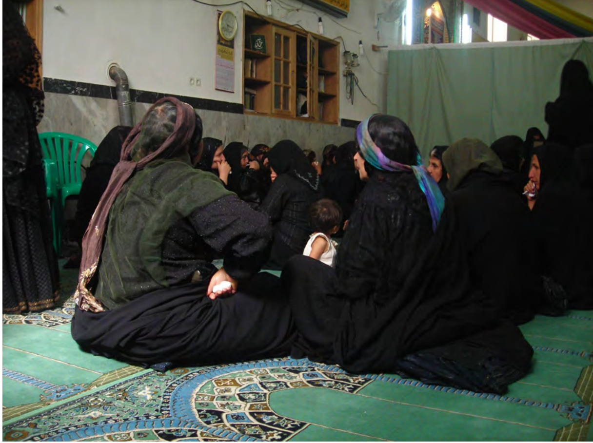
Yas - Şiraz -2008

belirtmektedir: Kaşkay Türklerinin coğrafyası, Türklerin ata yurdu Güney Azerbaycan tabir edilen coğrafyadır (Karatay 2012: 20).