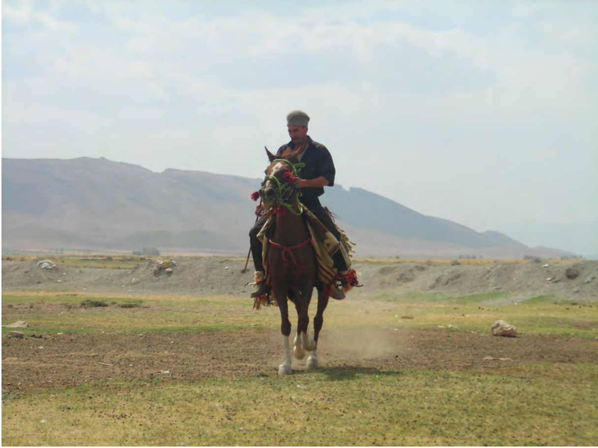
Mervdeşt -Şiraz- 2008

Fransızca-Farsça, Moğolca-Farsça, Türkçe-Farsça-Türkçe, Türkçe-Arapça-Türkçe, Farsça-Arapça-Türkçe, Arapça-Farsça-Türkçe birleşik ad yapıları da gösterilmiştir.