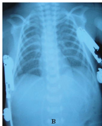
Şekil 1 A-B: Klinik bulgular ortaya çıktığında çekilen ve karın içinde yaygın serbest havanın (masif pnömo-peritoneumun) görüldüğü karın grafisi (A). Ameliyat sonrasında çekilen karın grafisi (B).