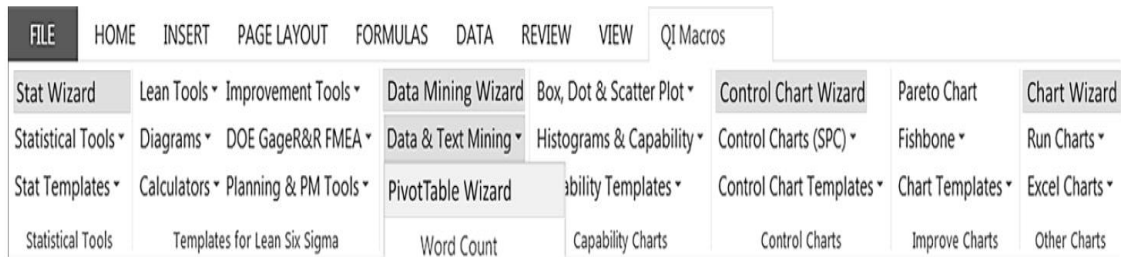
Şekil 3. Metin Madenciliği için Kullanılan Excel Eklentisi IQ Macros'un Ekran Görüntüsü

Son olarak metin madenciliği yöntemi için excel eklentisi olarak IQ Macros programı ders isimleri ve içeriklerinde yer alan kavramları tek tek saydırmak ve kıyaslamak için kullanılmıştır (Arthur, 2017, s, 1-36). Aşağıda program görüntüsü verilmiştir.