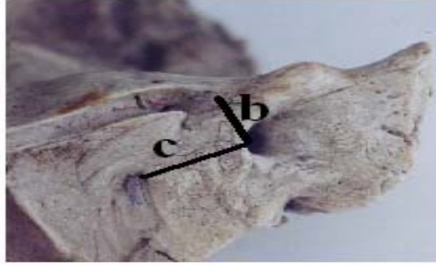
Şekil 1. PAI'nın dış kenarının sulcus sinus petrosi superior'a ve apertura externa aquaductus vestibuli'ye olan uzaklığı; b: PAI'nın dış kenarının sulcus sinus petrosi superior'a olan uzaklığı, c: PAI'nın dış kenarının apertura externa aquaductus vestibuli'ye olan uzaklığı.