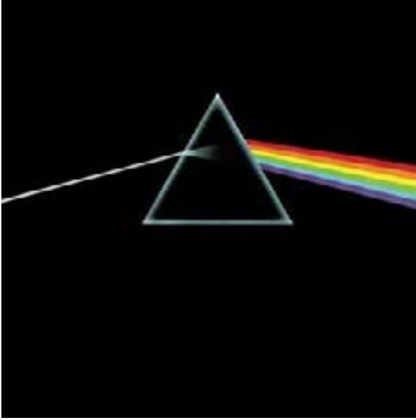
The Dark Side Of The Moon Albüm Kapağı, Hipgnosis, 1973.