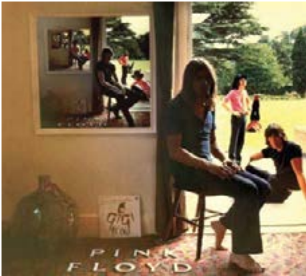
Ummagumma Albüm Kapağı, Hipgnosis, 1969.

Aşağıda bulunan tabloda bu albüm kapağına ait göstergebilim analizi verilmektedir.