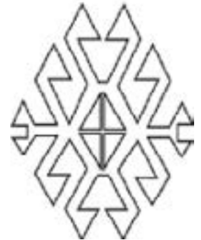
Şekil 4. Akrep motifi şematik çizimi, (Kılıç Karatay, 2019).

Yılan eğrisi: Literatür kayıtlarında hayat ağacını ve sonsuzluğu simgeleyen motif olarak bilinmektedir. Ancak halk dilinde yılan sırtına benzetildiği için yılan eğrisi denilmektedir (İn, 2019).