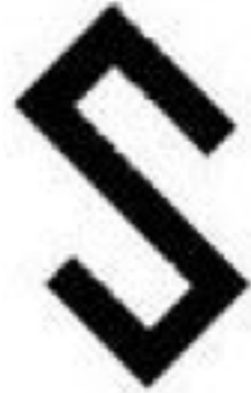
Şekil 2. Çengel motifi şematik çizimi, (Kılıç Karatay, 2019).

Göz: Geleneksel Türk sanatları motiflerinden olan göz motifidir. Özellikle nazardan koruduğu düşüncesiyle sepet örmelerin desenlerinde yoğun olarak kullanılmıştır (Çar, 2019).