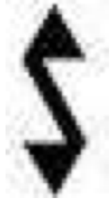
Şekil 5. Muska motifi şematik çizimi, (Kılıç Karatay, 2019).