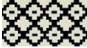
Şekil 3. Göz motifi şematik çizimi, (Kılıç Karatay, 2019).

Akıtma: Yörede örücülüğün ilk yıllarından beri akıtma olarak bilinen motifin kaynağı kesin olarak bilinmemektedir (Uz, 2019).