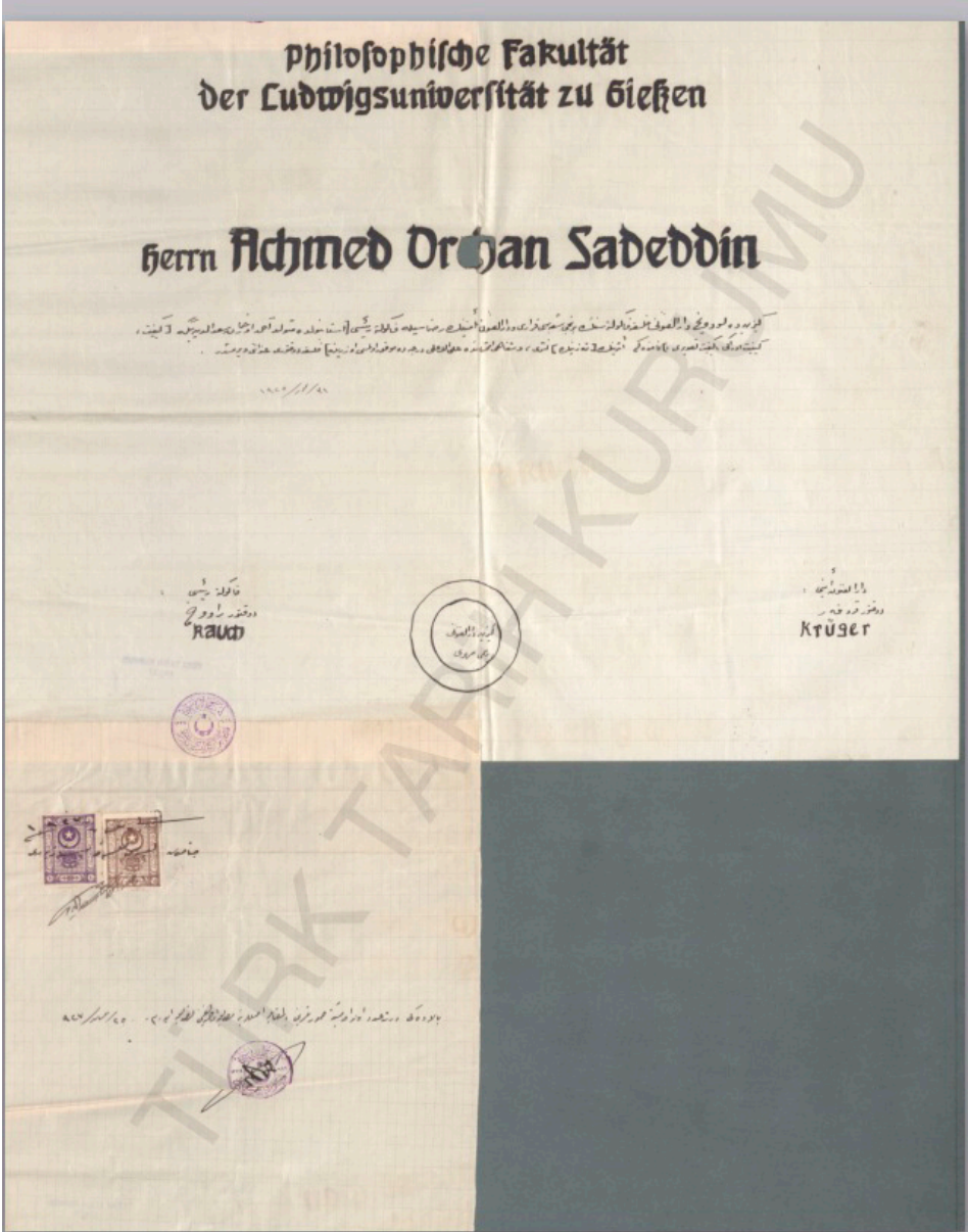
Fotoğraf 4: Orhan Sabeddin'in doktora diploması