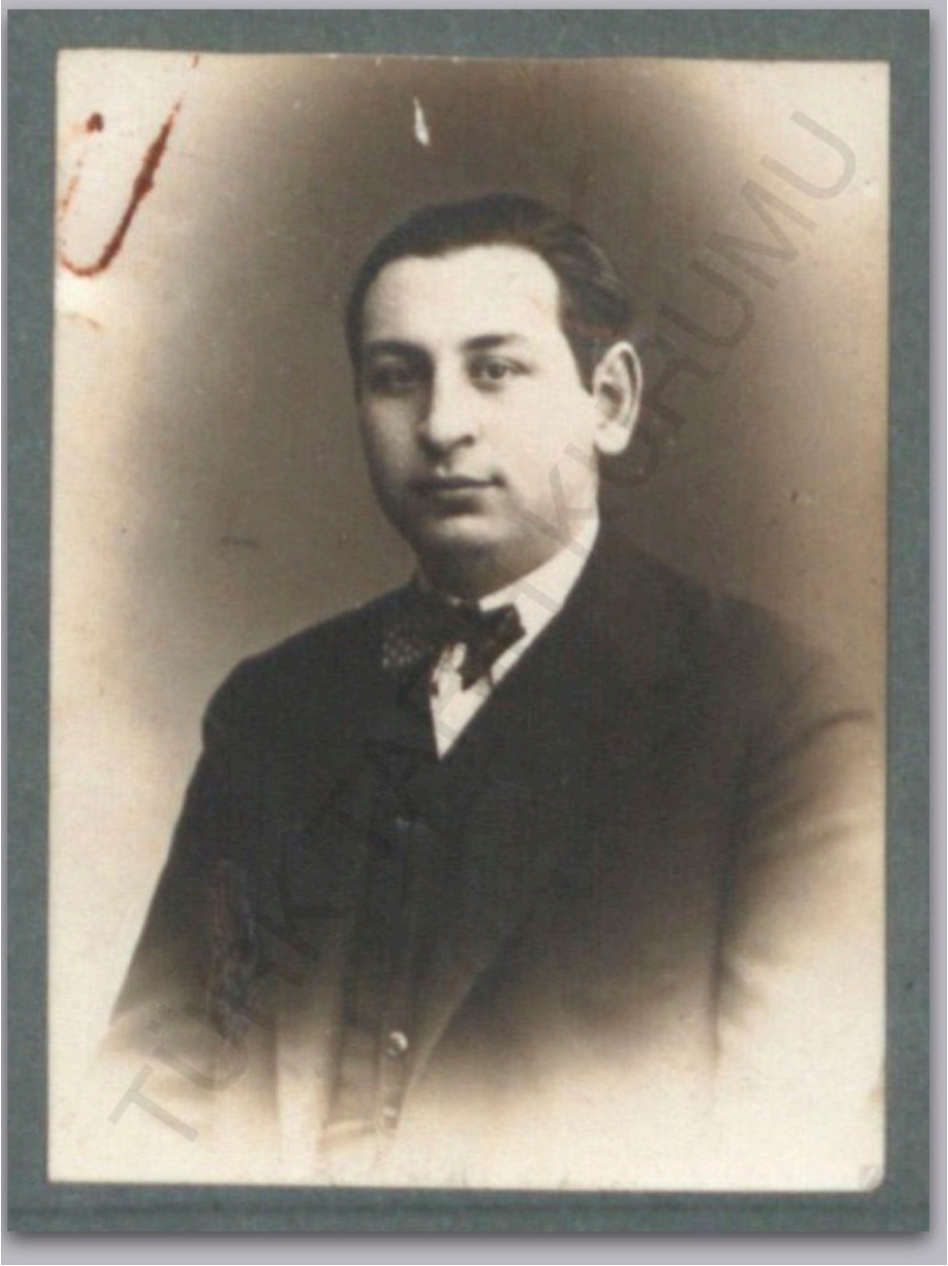
Fotoğraf 1: Orhan Sadeddin, muhtemelen 1920'lerin ortalarında