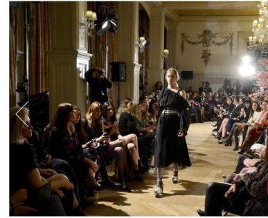
C) 2018 Sonbahar /Kış Lug Von Siga Defilesi - Pera Palas Oteli

http://www.vbenzeri.com/tasarim/tasarim-defile-mekanlari