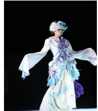
C) 2017 Egeye Bir Dokunuş Defilesi – Denizli Antik Kent Tripolis