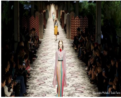
A) Eski bir tren istasyonu olan Scalo Farini’de sergilenen Gucci : Alessandro Michele