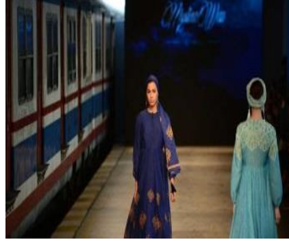
C) 1. İstanbul Modest Fashion Week Defilesi – İstanbul Tarihi Haydarpaşa Garı

Türkiye’den Tarihi mekânlar seçilerek yapılan moda defile örneklerinin verildiği Tablo 2 incelendiğinde ise, defile mekânı olarak, tarihi mekân seçilmesine karşın defile konsepti günümüz modasının modern çizgilerini yansıttığı söylenebilir. Bu durumun, tema ve mekân seçimi arasında zıtlık yaratarak ilgi uyandırdığı söylenebilir. Tablo 2/A’da Forum Fashion Week’in 5.’si Beyoğlu Pera Palas Otel’de yapılan çok özel bir defile ile ünlü moda eleştirmeni ve yazar Roger Salas’ın küratörlüğünde hazırlanan muhteşem kıyafetler konukların beğenisine sunulmuştur. Defilede Roberto Cavalli, Missoni, Giorgio Armani, Emporio Armani, Kenzo ve Jean Paul Gaultier gibi dünya modasının nabzını tutan tasarımcıların parçaları Roger Salas’ın küratörlüğünde podyumda sergilenmişlerdir ( http://htkulup.haberturk.com/multimedia/galeri/442769/28 ). Bu tür gösterilerde dünyaca ünlü tasarımların sergilenmesiyle birlikte ülkemize ziyaretçi akımı olmakta ve tarihi mekânların mistik havası ve etkileyciliği ile birlikte ülke tanıtımı konusunda faydalı olabileceği düşünülmektedir.