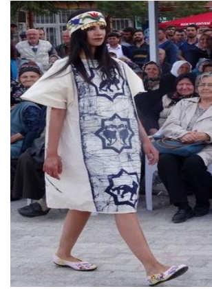
F) Eskişehir Han İlçesi-Gelenekten Geleceğe Defilesi