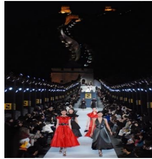
B) 2007 Fendi Defilesi, Çin seddi