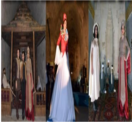
D) Erzurum Canlanan Mazi Defilesi – Erzurum Tarihi Yakutiye Medresesi