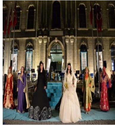
E) Diyarbakır Olgunlaşma Enstitüsü Defilesi – Diyarbakır Tarihi İç Kale