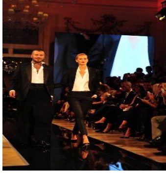
A) Forum Fashion Week Defilesi – Beyoğlu Pera Palas Otel