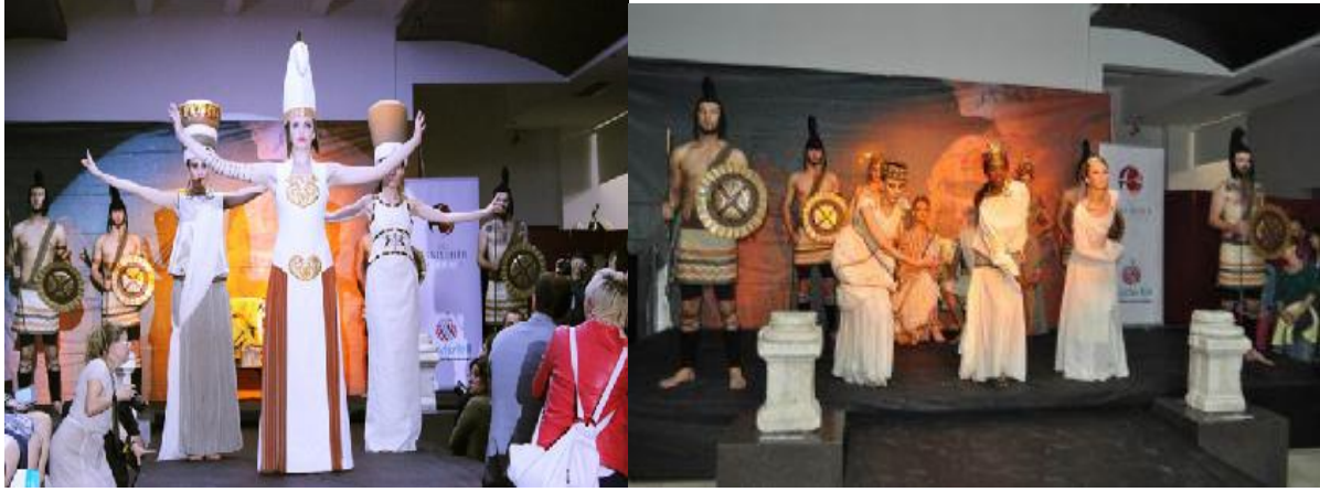
G) 2013 Eskişehir Eti Arkeoloji Müzesi- Frigya Defilesi