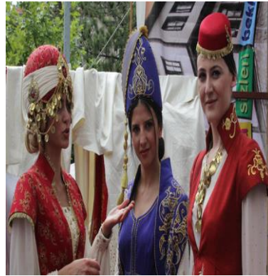
B) 22.Uluslararası Beypazarı Festivali Çağdaş Yorumlarla Anadolu Defilesi, Tarihi Suluhan Kervansarayı