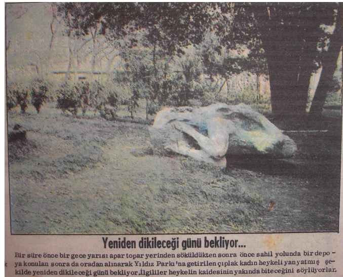
(Res.3) Heykel Yıldız Parkı'na dikilmeden önce gazetelerde bu şekilde yer almıştır.