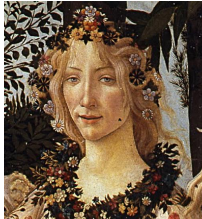
Görsel 8. Flora, (Detay)

Çiçek ve bahar tanrıçası "Flora, Roma'ya Sabin'lerden gelme bir tanrıçadır. Çiçek açan her bitkinin yönetimi onun elindedir. Şair Ovidius Flora üstüne Yunan mythoss'undan esinli bir öykü anlatır: Flora aslında Khloris adlı bir Nympha imiş, rüzgâr tanrı onu görüp kaçırılmış ve evlenmiş. Her türlü bitki ve çiçek üstünde egemenliği başılamış Flora'ya. Ama Flora'nın gücü bununla da kalmamış, tanrı Mars'ın doğmasına önemli bir etken olmuş: Jüpiter'in Minerva'yı kendi kafasından çıkarmasına içerleyen İuno erkek araya girmeden bir çocuk doğurmak istemiş tek başına, bunun için Flora'ya başvurmuş. Flora da bir kadına dokununca onu gebe bırakan bir çiçek vermiş İuno'ya, tanrıça da kendi kendine Mars tanrını getirmiş meydana. Romalılar yılın ilk ayına Mars (mart) adını vererek onun Flora ve baharla ilişkisini belli etmek istemişlerdir. Flora'nın onuruna Roma'da Floralia şenlikleri düzenlenirdi. Nisan sonunda başlayıp mayıs ayına kadar süren bu şenlikler büyük bir coşkunklukla kutlanırdı.