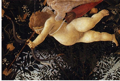
Görsel 12. Eros (Amour-Cupido) (Detay)

9. Eros (Amour-Cupido): Resimde 9 numaralı figür Eros'tur. "Yunan mitolojisinde Eros, aşk, seks ve şehvet tanrısıdır. Bazen doğurganlık tanrısı olarak da tapılan Eros, erotik gibi kelimelerin de kökünü oluşturur. Eros, genelde Afrodit'le beraber anılır ve Dionysus gibi bazen Eleutherios yani kurtarıcı olarak görülür.