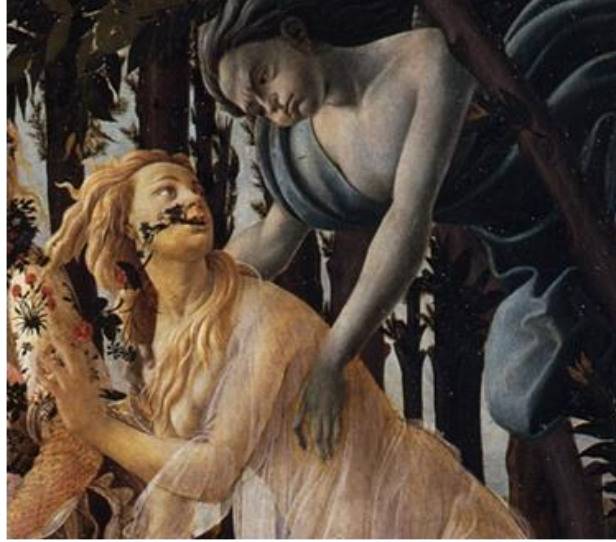
Görsel 9. Zephyros ve Flora/Hloris, (Detay)

3. Zephyros (Zefiros): Resimde 3 numaralı figür Zephyros'tur. Romalılar buna Favonius derler. “Zephyros bir titan (dev) olan Astraeus (yıldızlar, astronomi ve astroloji tanrısıdır, Zeus tüm devlerle birlikte Titan Savaşı sonunda onu da Tartaros'a hapsetti) ve şafak tanrıçası Eos'un (Aurora) oğluydu. Rüzgarlar (Anemoi'ler) ölümsüzdü ve kendilerine vücut olarak havayı seçmişlerdi.