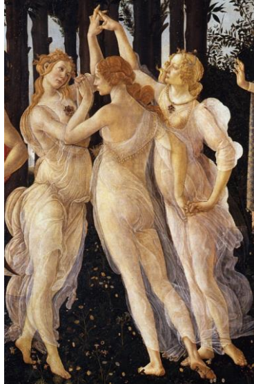
Görsel 11. Üç Güzeller (Detay)

Tanrıçalar başlamışlar akıllarına gelen vaatlerle çobanı etki altına almaya. Atena; ün, şan vaat etmiş, Hera; zenginlik ve kuvvet. Venüs ise, dünyanın en güzel kızını vaat etmiş. Atena ve Hera en güzel elbiselerini giyip, en süslü mücevherlerini takmışlar, oysa güzellik örtü istemez, güzellik onun örtüsü diyen Venüs bunların hiçbirini yapmamış. Paris'in altın elmayı tutan eli kıvıldamış... herkes heyecan içinde ve el geniş bir kavis çizerek Venüs'e doğru uzanmış. Paris üzerinde "en güzele" yazan altın elmayı Venüs'e vermiş" (Üç Güzeller Masalı, 2019).