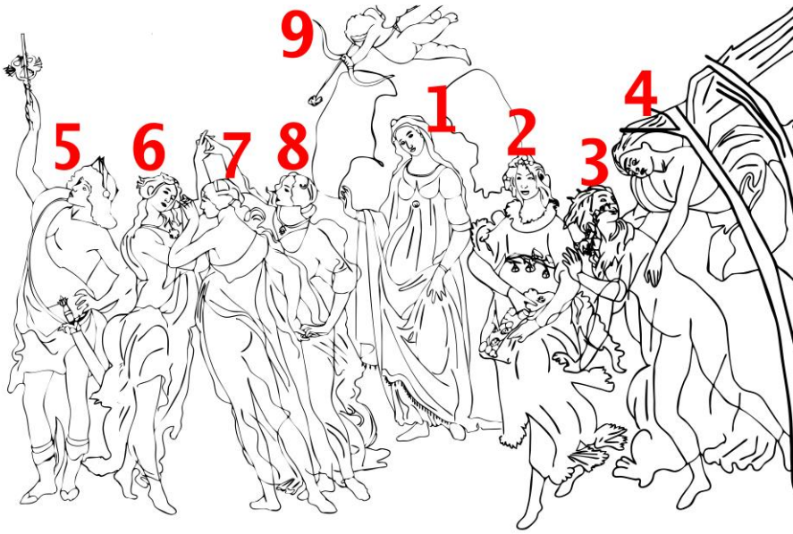
Görsel 6. Mitolojik Figürlerin Dizilimi