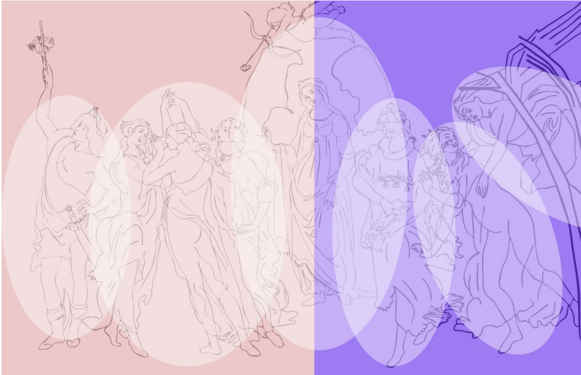
Görsel 5. Resimdeki Işıklı Alanlar

Resimdeki görsel göstergelerin çözümlenmesi, resmin görünen kısmından çok alt anlatılarının kavranması için önemlidir. Resimde yer alan figürler aslında mitolojik kahramanların ikonlarıdır. Bu nedenle tüm figürleri tek tek ele alıp, asıl anlatılarını açığa çıkarmak resmin bütünsel anlamını kavramamızı sağlayacaktır. Resimdeki mitolojik figürlerin dizilimi (Görsel 6) şöyledir: