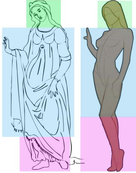
Görsel 13. Venüs'ün Vücudun Gerçeğe Oranı

Eros'un gözleri bir bağla örtülü olarak betimlenmiştir. Aşk'ın, gözlerinin kör olduğuna vurgu yapan bu betimleme, bir eğretilemedir . Sanatçının bu kullanımları, onun, sanatına ne kadar hâkim olduğunu göstermenin yanında, resmin derin anlamlarını da açığa çıkarmada önemlidir.