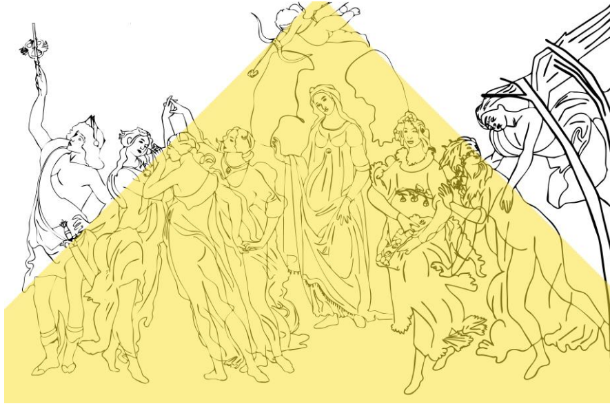
Görsel 2. Resmin Üçgen Kompozisyonu

Resimde her ne kadar kanatlı iki figürün, kanatları resmin dışına taşıyorsa da (bu onların uçuş eylemlerine bir gönderme içermektedir) resimde bulunan tüm kişiler resim alanının kapsayıcılığı içerisinde değerlendirilebilir, bu da resmin kapalı kompozisyon kurgusunu çağırır. Merkezdeki figür dışındakiler, izleyiciye değil ya birbirlerine ya da resim alanı dışındaki belirsiz bir bölgeye bakmaktadırlar (Görsel 3). Bu merkezdeki figürün doğrudan izleyici ile iletişimini sağlarken, diğer bakışlardan ötürü resmi yan alanlara taşır. Böylece ressam resim için birkaç bakış açısı sağlamayı hedeflemiştir.