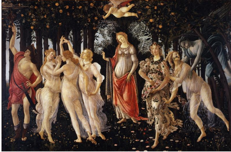
Görsel 1. Sandro Botticelli, “İlkbahar Alegorisi” 1477-78, (315 x 205 cm), Tempera.

Resmin en solunda bir erkek figür bulunmaktadır. Bu figür, kırmızı, sade ancak zengin işlemeli bir elbiseye sarılmıştır, şapkalıdır, sağ eli gökyüzünü işaret eder şekilde esasıyla ağaçların arasından gökyüzünü işaret eden, resmin bakış açısına yan, diğer figürlere ise arkası dönük bir duruş almıştır, sol eli ise belinde, kılıcının yanında resimlenmiştir. Sadece bu figür sandaletli diğerleri ise yalın ayak resimlenmişlerdir. Bu figür de izleyiciye değil yukarıya bakar haldedir.