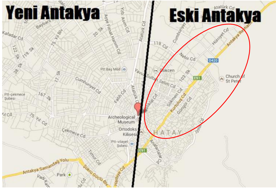
Şekil 1: Eski ve Yeni Antakya (Cengiz, 2014).