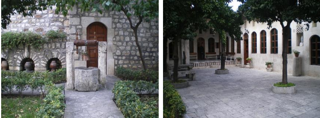
Şekil 6: Geleneksel Antakya evlerinde kuyu ve seki detayı (Orijinal, 2016).

Sokak tarafına bakan duvarın altında bulunan ve avlu yıkandığı zaman suların dışarıya çıkmasını sağlayan kanala “bellaa” adı verilir. Avluda yer alan bir diğer sabit eleman ise “soku” olarak adlandırılan, ev halkının bulguru veya biberi bir tokmak yardımıyla içinde döverek küçük taneler haline getirdiği taş havandır. Odalardan birinin altında “hazin” denilen ve içine hayattan taş merdivenle inilen, tabandan 50-60 cm yüksekte ışık ve hava alabilen sığınak ve yiyecek depolama mekanları yer almaktadır. Avluda bulunan, üç yanı kapalı olup iki basamak merdivenle çıkılan kapısız mekana “livan” adı verilir ve burası yazlık dinlenme yeri olarak kullanılır. Livanın zemininde, üç tarafı çeviren, “kerevit” adı verilen, taştan sedirlik vardır. Buraya minder serilerek oturulur. Evin avlu cephesinde bulunan ve avluya açılan yerlerinde kuş takalarının iki türü vardır (Şekil 7). Birincisi odaların içine açılanı, ikincisi ise niş türünde olup kapalı olanıdır. Bu takalar yerden 3-4 metre yukarıda bulunup çevre taşları rölyef desenlerle bezelidir. İki amaç için kullanılır: Birincisi güvercin ve benzeri kuşların barınmalarını sağlamak, ikincisi ise yazın odanın içindeki tarafın camı açılarak hava