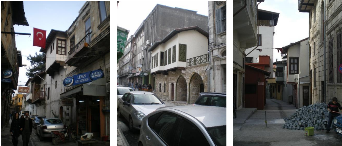
Şekil 2: Geleneksel Antakya evlerinin yer aldığı eski Antakya sokakları (Orijinal, 2016).

Eski konut dokusu bünyesinde yer alan Antakya evlerinin çoğu aynı plan ve üslup birliği içinde inşa edilmiştir. Dar sokakların etrafında gelişen evleri dışarıdan tanımlamak oldukça zordur (Şekil 2). Evlerin sokakla ilişkisi doğrudan bulunmaz. Sokaktan bir avlu duvarıyla ayrılan evler, kendi içine dönük bir anlayışta planlanmışlardır. Yüksek taş duvarlı, içerisinde avlu etrafında odaların sıralandığı genellikle tek katlı veya iki katlı olan bu evler halkın yaşayış biçimini, gelenek ve göreneklerini yansıtan mekanlardır.