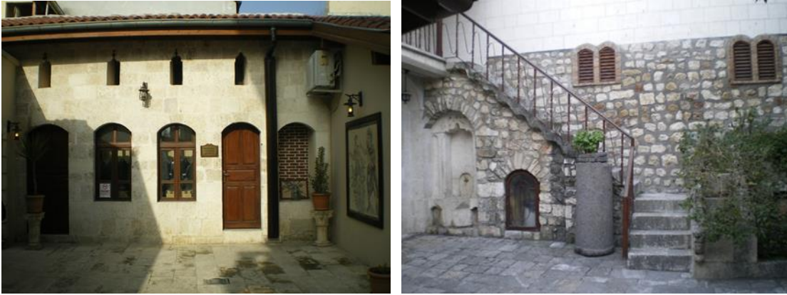
Şekil 7: Geleneksel Antakya evlerinde kuş takası ve merdiven örneği (Orijinal, 2016).

İki katlı olan evlerde üst kata, bir ucu bahçe duvarına saplanmış desteksiz bir taş merdivenle çıkılır. Genelde duvara ankastre, masif taş basamaklardan oluşan merdiven, üst katta odaları birbirine bağlayan konsol bir koridora ulaşır (Şekil 7). Bu koridor genelde avluya açık bir balkon şeklindedir. Mutfak, banyo ve helâ genellikle odalardan bağımsız olup avluda yer alır.