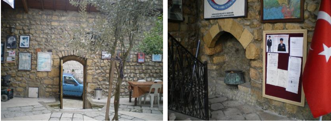
Şekil 5: Geleneksel Antakya evlerinde avlu kapısı ve ocak detayı (Orijinal, 2016).

Evlerin avlularının zeminleri genellikle aynı tarzda ve eşit ebatlardaki kesme taşlardan oluşmaktadır. Bu bölgenin iklim koşullarına uygun ve oldukça akılcı çözümler sunan avlular, bazen mermer veya desenli karo mozaik ya da dökme mozaik ile kaplı olabilirler. Genelde mutfak kısmına yakın bir yerde bulunan kuyu, sabit bir elemandır (Şekil 6). Avluda bulunan bir diğer sabit eleman ise halk arasında “bürke” olarak tabir edilen, fiskiyeli havuzlardır. Bu havuzların büyüklüğü değişken olup serinlik verme amacını taşır ve genelde mermerden ya da taştan yapılmışlardır. Avlunun büyüklüğüne uygun olarak, bir köşede “seki” yer alır (Şekil 6). Çok amaçlı olan ve üzeri kesme taş, mermer, desenli veya karo mozaik kaplı olan seki, ailenin günlük hayatı içinde oturma ve yemek köşesi olarak kullanılır.