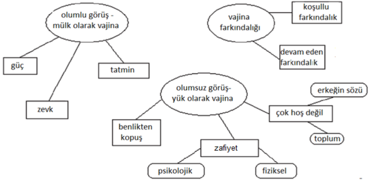
Şekil 3. Üç ana temayı gösteren geliştirilmiş tematik harita [nihai analiz Braun ve Wilkinson'un (2003) çalışmasında sunulmuştur]

Bu aşamanın sonunda ortaya, aday temalar ve alt temalar ile bunlarla ilişkili olarak kodlanmış tüm verilerden oluşan bir ürün çıkar. Bu noktada, araştırmacı her bir temanın önemini hissetmeye başlar. Ancak, bu aşamada analizin bittiği yanılgısına düşmemek gerekir, çünkü bir sonraki aşamada kodlanmış veri içeriği ayrıntılı bir şekilde incelenmeden, temaların olduğu gibi kalıp kalmayacağına veya bazılarının birleştirilmesi, sadeleştirilmesi, ayrılması ya da atılması gerekir gerekmediğine karar vermek mümkün değildir.