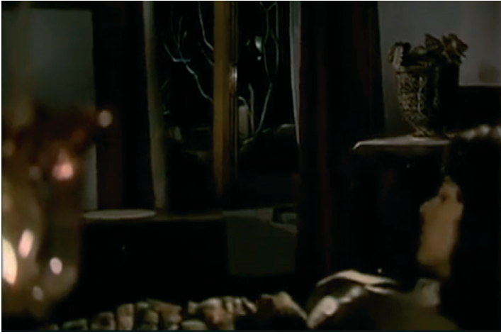
Görsel 6. Siyah Gelinlik filminden görüntüler – Camdan görünen ağaç

Daldan düşen her yaprak hayatımdan bir gün eksiltiyordu. Son yaprakla hayatımın son günü de gelip çatmıştı. Sabaha karşı yaprak düşecek, düşerken hayatımı da birlikte götürcekti... (Görsel 6 ve Görsel 7).