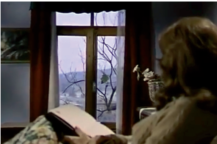
Görsel 7. Siyah Gelinlik filminden görüntüler- Tek yapraklı ağaç