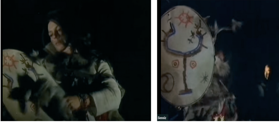
Görsel 3. Gökçe Çiçek filminden görüntüler - Kam davulu

Filmde dikkat çekici bir diğer unsur ise, Şamanizm'e yapılan göndermelerdir (Görsel 3). Ömer Lütfi Akad'ın "olgunluk" dönemi filmlerinden olduğu kabul edilen Gökçe Çiçek 'te, Şamanizm'e dayanan inanç ritüellerine değinilmesinin önemine işaret edilirken (Hakan, 2008: 455) Erbek'in, Türklerde ağaç motifinin kökeninin Şamanizm olduğu vurgusu (2002: 166) akla gelmektedir. Bu noktada, ağaca atfedilen kutsallığın kökeninde Şamanizm'in etkilerinin olduğunu söylemek mümkündür. Güvenç (2002: 89), Türk kültürü ve kültürel