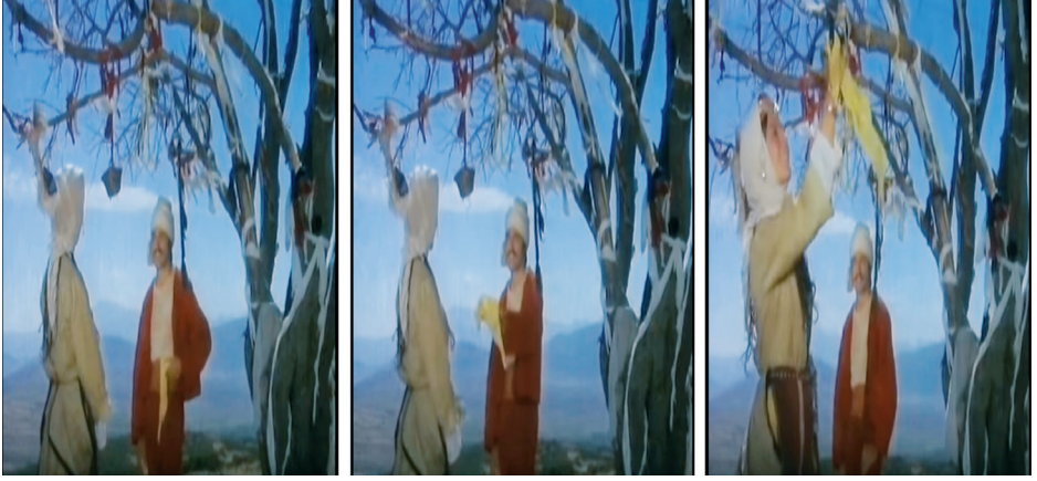
Görsel 1. Gökçe Çiçek filminden görüntüler – Dilek ağacına mendil bağlama

ilgi çekmektedir. Bu türkü, filmde ağaca atfedilen önemin göstergesi olarak kabul edilebilir. Doğrudan dilek ağacına işaret eden türkünün sözleri şu şekildedir: