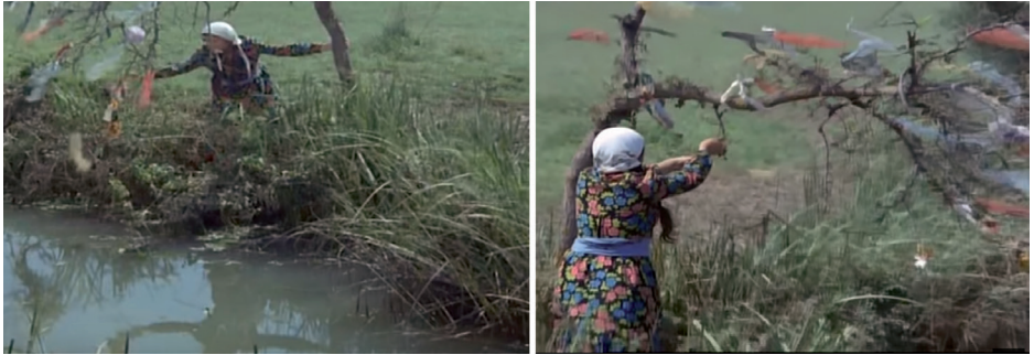
Görsel 4. Tatlı Dillim filminden görüntüler- Ağaca çaput bağlama