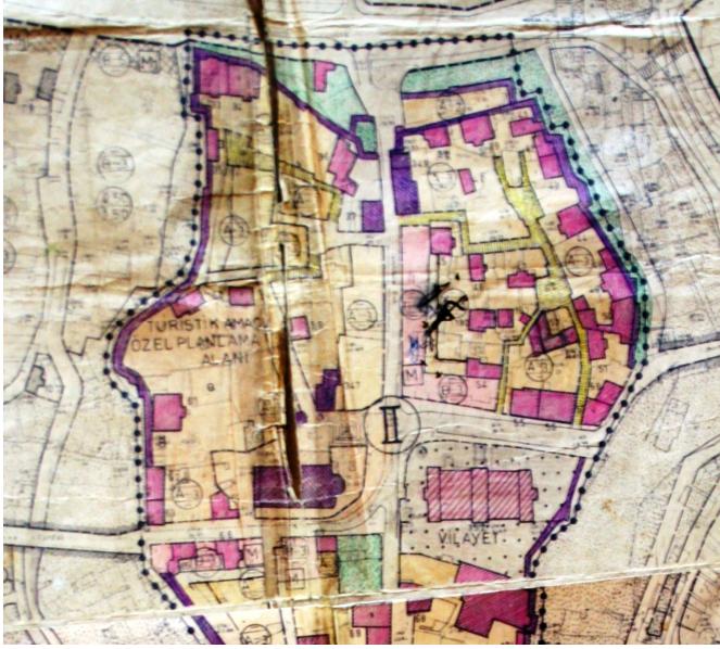
Harita 1: Ortahisar Kentsel Sit Alanı Haritası