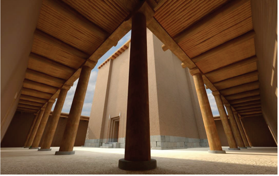
Çiz. 2: Tapınak Yeniden Kurma Denemesi