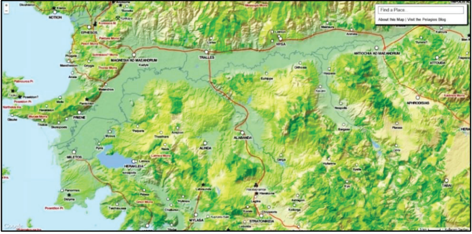
Harita 1: Alabanda Harita