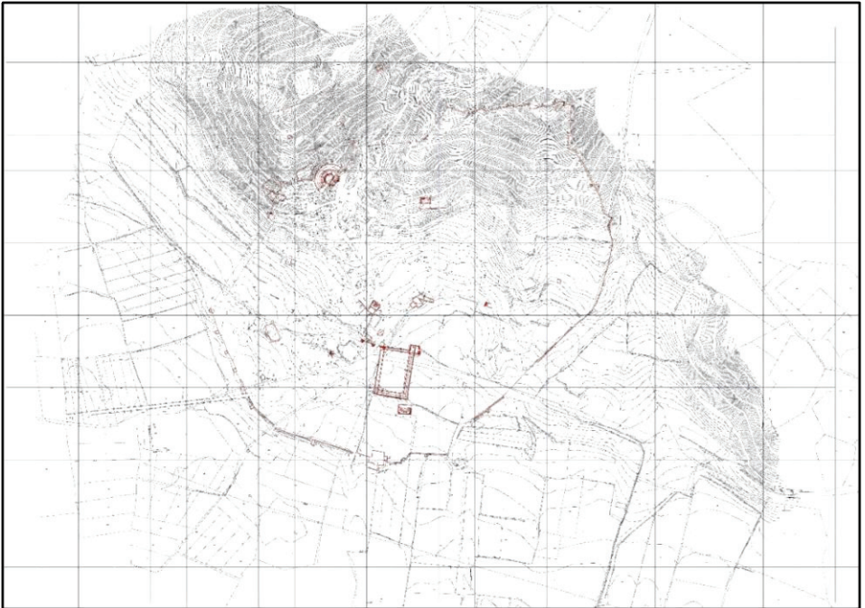
Harita 2: Alabanda Kent Planı