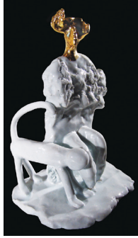
Resim 3: Erdinç Bakla, Çatalhöyük, Mother-Goddess 1. porselen, 25x13x10 cm, 2010.

ilerleyebileceğini” 2 düşünmektedir. Bakla, “kendi özü” olarak nitelendirdiği Anadolu topraklarının farklı dönemlere ait arkeolojik buluntularını kendi plastik anlayışı ile yorumlayarak yeni imgeler yaratmaktadır. Aşağıdaki örnek Çatalhöyük kazılarında esinlendiği çalışmalarındandır.