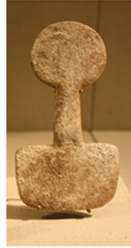
Anadolu'da Bronz Çağında Yapılmış Mermer Tanrıça, Metropolitan Müzesi, ABD.