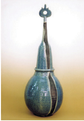
Resim 4: Cemalettin Sevim, Seramik Form, 2000.