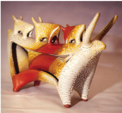
Resim 1: Sadi Diren, Seramik Form. 1987.

Çağdaş Türk seramik sanatında arkeolojik imgelem dendiğinde belki de ilk akla gelen isim Sadi Diren’dir. Sadi Diren; “1953’de İstanbul Güzel Sanatlar Akademisi Seramik Bölümü’nden mezun olur. Davetli olarak gittiği Almanya’da 1964 yılına kadar endüstride tasarımcı olarak çalışır ve bu yıllarda serbest sanatçı olarak yaptığı çalışmalarla uluslararası bir ün kazanır. 1964 yılından başlayarak seramik dersleri verdiği Güzel Sanatlar Akademisindeki atölyesinde, yeni seramik ustalarının yetişmesine öncülük eder” .(Giray, 1998: 27)