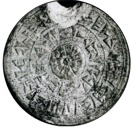
Resim 5: Kamuran Özlem Sarnıç, İzler, 2000. Tuhurvaili'nin mühür baskısı, Anadolu Medeniyetleri Müzesi, Ankara.

Resim: 5’te verilen örnek eserde ise Hitit mühürlerinin imlerini Anadolu topraklarının diğer imleri ile birlikte” İzler” adını taşıyan seride yorumlanmıştır. Bu eserlerde mühürleme eylemi kavramsal olarak ele alınmış ve Anadolu’ya damgasını vurmuş iki devlet olan Hitit ve Osmanlı’nın izleri imgeleştirilmiştir.