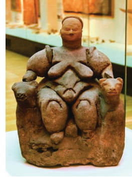
Çatalhöyük Ana Tanrıça heykelciği, Anadolu Medeniyetleri Müzesi, Ankara.