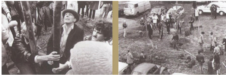
Tablo 3: Joseph Beuys, “7000 Meşe projesi”, 1982,Kassel