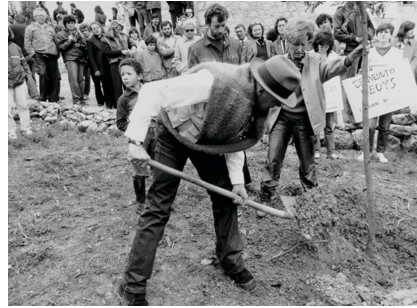
Tablo 3: Joseph Beuys, “7000 Meşe projesi”, 1982,Kassel

Beuys’un projesi bu bağlamda incelendiğinde ütopyik bir düşüncenin gerçekleştirilmiş somut bir eylemidir Beuys, bugünün ve geleceğin dünyasını biçimlendirmeye yönelik tavrıyla ütopyist bir sanatçı olarak karşımıza çıkmaktadır.