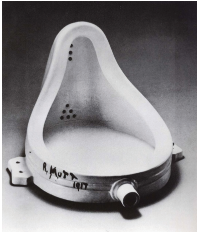
Tablo 2: Marcel Duchamp, "Çeşme", Porselen Pisuar, 33x42x52cm, Moderna Museet, Stockholm

Tatlin'in III. Enternasyonal için gerçekleştireceği, 396,5 m. yüksekliğinde, içinde kafelerin, seminer, konferans ve sergi salonlarının olacağı, cam ve çelik bir konstrüksiyondan oluşacak olan anıt, sanatçı için de ütöpik bir sanat eseri olarak kalmıştır. Sanatçı dev spiral yapının içinde silindir, küp ve küreleri hareket ettirmeyi hayal etmiş ve bu eser aslında kinetik heykelin ütöpik düşüncesi olarak kalmıştır. Tatlin sadece 6.7 m. yüksekliğinde ahşap konstrüksiyondan oluşan maketini yapmıştır. Tatlin'in III. Enternasyonal anıtı adlı eseri günümüz teknolojisiyle bile imkânsız görünmektedir. Sonuçta sanatçı için ütöpik bir eser olarak sadece düşünce bazında kalmaktadır.