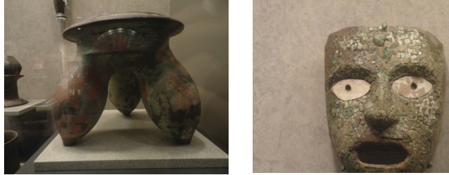
Görsel 4- 5: Farklı yapıda kap ayakları, Meksika Antropoloji Müzesi

Maya seramiği, vazolar, çanaklar, ritonlar, mühürler, ocaklar, tabaklardan müzik aletlerine uzanan zengin bir çeşitlilik gösterir. Seramik eserlerin çoğu geometrik motiflerle bezenmiştir. Ayrıca bu eserlerde hayvan ve insanların temsil edildiği görülmektedir. Kalınlıkları fazla olmayan ince ve simetrik tarzda yapılan Maya seramiklerini genellikle cilalı, çok renkli ve bazen de tek rengin çeşitli tonlarıyla renklendirme tekniği kullanılarak hazırlanmış oldukları göze çarpmaktadır. Genellikle açık fırınlarda 800 °C varan derecelerde pişirildiği bilinen seramik eserlerdeki süslemeler maya yazısı ile yazılmış metinleri, soylularla, askeri olaylarla ilgili sahneleri