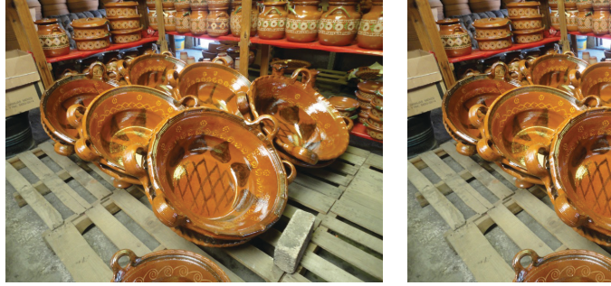
Görsel 8-9: Geleneksel Metepec seramikleri, Metepec Meksika, (Fotoğraf: Öznur Yıldırım)

Geleneksel seramik üretimi yapılan Mepetec’te içi sırlı mutfak kapları (tencereler, kaseler, kupalar) kuru kafalar, fantastik öğelerle bezenmiş güneş, ay rölyepleri ve renkli boyanmış hayat ağaçlarının üretimi devam etmektedir. Diğer önemli bölgelerde de geleneksel kültüre bağlı üretimlerin sürdüğü bilinmektedir (Görsel8- 9).