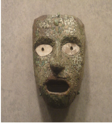
Görsel 6: Seramik maske, Meksika Antropoloji Müzesi

Mayalar yaptıkları seramik formlar üzerine insan, hayvan figürlerini ve güncel olayları rölyef ve resimsel olarak işleyerek yerleştirmişlerdir. Günlük kullanım kap kacakları dışında anlam ve görevler yüklenen maya seramikleri, fantastik yaratıcılık örnekleri ile dekorlu kaplar, ritonlar, insan ve hayvan silüetleri taşıyan kaplar ve heykeller olarak karşımıza çıkmaktadırlar. Mayalar taştan yapılan maskelerin yanında seramikten çok karakteristik ve güçlü ifade anlamı olan maske örnekleri de yapmışlardır. Meksika'nın önemli kültür mirası olan seramik ve diğer malzemelerden yapılan maskeler "Anadolu ve Orta Amerika Ülkelerindeki Geleneksel Seramik El Dekorlarının Karşılaştırılması" isimli, (1306E224 numaralı) Anadolu Üniversitesi Yayın ve Araştırma Teşvik Projesi kapsamında Meksika'ya yapılan araştırma gezisinde en dikkat çekici objeler arasındadır.(Görsel 6)