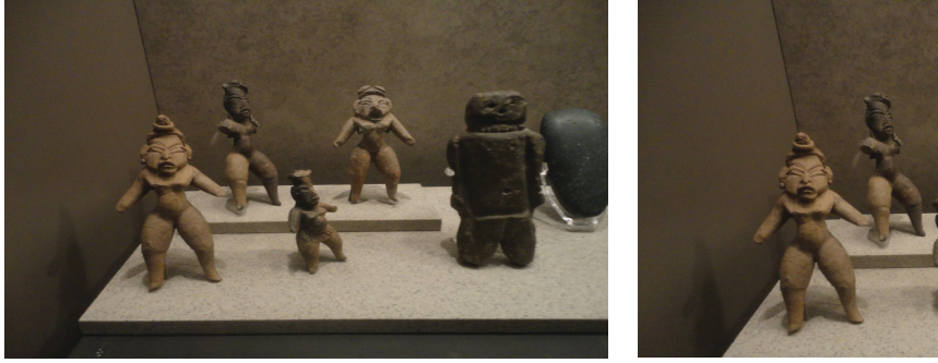
Görsel 10-11: Maya döneminden mikro seramik heykeller, Meksika Antropoloji Müzesi