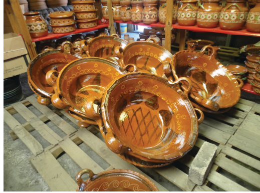
Görsel 7: Talavera Seramikleri, Pueblo Meksika, (Fotoğraf: Cemalettin Sevim)

Geleneksel seramik üretimi yapılan Mepetec’te içi sırlı mutfak kapları (tencereler, kaseler, kupalar) kuru kafalar, fantastik öğelerle bezenmiş güneş, ay rölyepleri ve renkli boyanmış hayat ağaçlarının üretimi devam etmektedir. Diğer önemli bölgelerde de geleneksel kültüre bağlı üretimlerin sürdüğü bilinmektedir (Görsel8- 9).