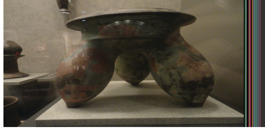
Görsel 3: Dekorlu maya kâseleri, Meksika Antropoloji Müzesi

Meksika’ da Maya seramiklerinin yapımı ve etkinliği, Maya kültürünün kuruluşundan Kolomb’un Amerika kıtasını keşfi öncesine kadar sürmektedir. Bu dönem seramikleri, torna tekniği kullanılmadığından, dönen bir tabla üzerinde, kırmızı ya da bej kil kullanılarak elle veya kalıp yöntemiyle yapılmıştır.(Görsel 3)