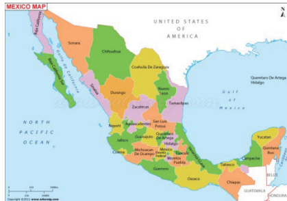
Görsel 2: Meksika haritası ( http://www.thinglink.com/scene/365590627666100225 )

Bildiğimiz çömlekçi ürünleri genellikle küpler, vazolar, çanak çömlekler, saklama kapları gibi klasik ürünlerdir. Bu ürünler üzerindeki biçimler; tutamak, emzik, kapak, kulp gibi parçalardan oluşmaktadır. Meksika çömlekçiliğinin; değişik tekniklerle oluşturulması, üzerlerinin değişik yöntemlerle süslenmesi, parçaların kaplar üzerine yerleştirmeleri ve kaplara verilen teknik özellikler onların kimliğini oluşturmaktadır. Bir ürünün kimliği, içinde bulunduğu kültür ile yakından ilgilidir. Sanatçı veya zanaatkar yetişirken düşünce ve ustalık olarak içinde bulunduğu toplumdan beslenerek eserlerini üretir. Farklı kültürlerde yapılan çömlekçilik gibi geleneksel üretimlerde, şartlara ve beklentilere göre değişik tasarımlarla farklı algısal değerlere ulaşılabilir. Bu aşamada bazen sanatsal değerler ön plana çıkarken bazen de fonksiyonel değerlerin ön plana çıktığı görülmektedir. Görsel yapıdaki algısal değerleri oluşturan en önemli özellikler boyut, biçim ve formu oluşturan dekorun yanında parçaların uyumudur. Bu bağlamda geleneksel seramik sanatı denildiğinde çok fazla bir beklenti içinde olunması düşünülemez. Gelenekselden beklenti; belirli geleneğin, kültür ve dönemin değerlerini taşımasıdır. Geleneksel üretimlerden kültürel yapısının dışında farklı üretimler beklemek yanlış olur. Çünkü ondan sonrası çağdaşığa ve çağdaş yorumlamalara girer. Bu üretimlerin değerlendirilmesi de farklı bir bakış açısı gerektirmektedir.