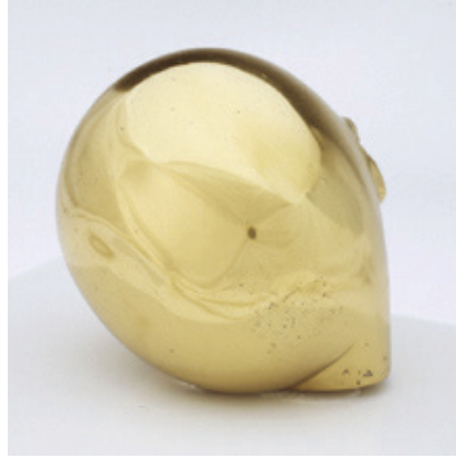
Resim 11: Prometheus, Brancusi

Özellikle Brancusi, heykellerinde mitolojik öyküleri sıkça kullanmıştır. Maiastra “altın kuş” heykeli Romanya’da halk arasında yaygın olan bir efsanenin kahramanıdır. Efsaneye göre Maiastra mistik güçleri olan altın bir kuştur. Sesi sihirli güçlere sahiptir. Brancusi heykelinde bunu vurgulamak için kuşun gagasını açık yapmıştır. Malzemesi bronz olan bu heykel iyi bir polisaj aşamasından sonra altın gibi parlatılmıştır ve bu da zenginliği vurgulamaktadır.