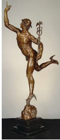
Resim 8: Uçan Merkür Giovanni, Bologna Metropolitan Sanat Müzesi, New York

( Manyerist dönemi ) heykeltıraş Bologna ‘Uçan Merkür’ heykelinde konu anlatımından çok estetik kaygılar taşıyarak ve kendi özgünlüğünü yansıtacak şekilde çalışmış sanatçı özelliğinin güçlenmesine örnek olmuştur.” 18