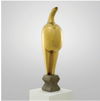
Resim 10: Maiestra, Brancusi

Rönesans ve sonrasında heykel sanatının hem içerik hem de biçimsel evrimi 19. yy ile birlikte yeni ve evrensel bir dilin ifade aracı olarak varlık değeri kazanmıştır. Her alanda yaşanan değişimler, dünya savaşları, sanayileşme, Fransız