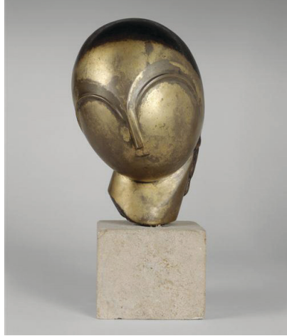
Resim 12: Constantin Brancusi, Danaid, 1913, Bronze, National Museum Of Modern Art

Özellikle Brancusi, heykellerinde mitolojik öyküleri sıkça kullanmıştır. Maiastra “altın kuş” heykeli Romanya’da halk arasında yaygın olan bir efsanenin kahramanıdır. Efsaneye göre Maiastra mistik güçleri olan altın bir kuştur. Sesi sihirli güçlere sahiptir. Brancusi heykelinde bunu vurgulamak için kuşun gagasını açık yapmıştır. Malzemesi bronz olan bu heykel iyi bir polisaj aşamasından sonra altın gibi parlatılmıştır ve bu da zenginliği vurgulamaktadır.