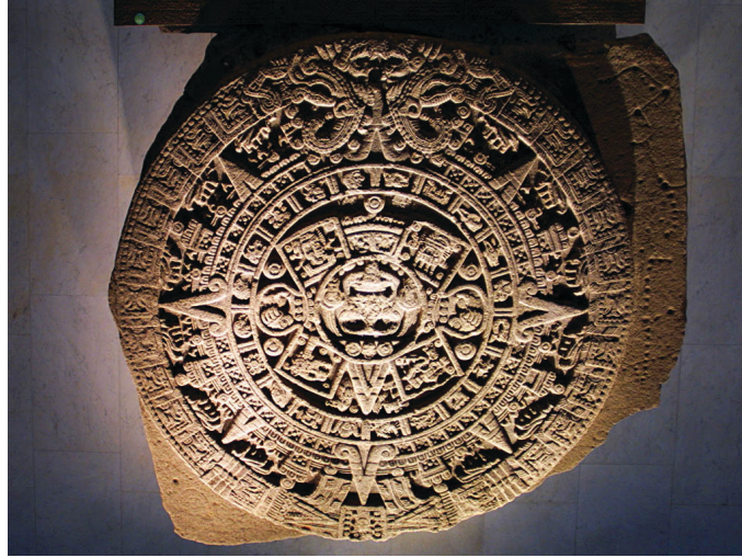
Resim 6: Maya Takvimi

Maya uygarlığı; Maya halkları tarafından kurulan Kolomb öncesi yerli Amerika uygarlıklardan biridir. Bir Orta Amerika uygarlığı olan Maya uygarlığı, binlerce yıl boyunca Meksika'nın güneydoğusundan, Honduras, El Salvador, Yucatan, Kostarika ve Guatemala'ya kadar uzanan bir bölgede egemenlik kurmuştur. M.S 250-900 arasında yaşayan bu uygarlık, İspanyol işgaline kadar geniş bir alanda varlığını sürdürmüştür ve sona erme sürecine girmiştir. Maya uygarlığı birçok bakımdan sona ermişse de, yaygın inanışın aksine anlatılan efsaneler ve Maya mitlerinin etkisi ile de yok olmadıklarına ve halen yaşadıklarına inanılmaktadır. Maya efsaneleri ve mitleri ilk çağ uygarlıkları gibi doğa ve kozmik güçler etrafında gelişmiştir. Popol Vuh, Mayaların yaratılış efsanesini anlatan en önemli belgedir. 15