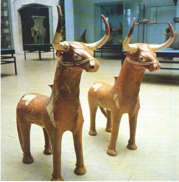
Resim 1 : Hitit Boğa Heykelciği

dili en güçlü olan heykel sanatının da vazgeçilmez konularından olmuştur. Fiziksel ve maddesel olarak kalıcı olan heykeller, mitosların günümüze aktarılmasında da önemli rol üstlenmiştir. Mitsel öyküler özellikle rölyef ve heykellerle geleceğe taşınmıştır. 4