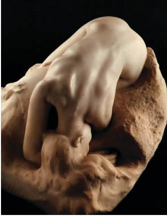
Resim 13: Auguste Rodin, Danaide

Brancusi'nin mitolojiden esinlenerek ürettiği bir diğer heykeli de Danaidedir. Danaide; Danaus'un kızlarına verilen addır. Mitosa göre kral Danaus ile kardeşi Aegyptus'un arası açıktır. Aegyptus bu kavga ortamını bitirip barışı sağlamak için 50 oğlunu Danaidlere evlenme teklif etmesi için gönderir. Bunun üzerine kral Danaus gizlice kızlarına evlilik gecesi kocalarını öldürmelerini emreder. 40'ı kocasını öldürür ancak bir tanesi bekaretine saygı duyduğu için kocasını öldürmez. Bunu duyan Hades kocalarını öldüren Danaidlere sonsuza kadar göle su taşıma cezası verir. Babasına karşı çıkan Danaid ise erdemli insanın simgesi haline gelir .Brancuside bu heykelinde erdemli insanın yorumunu Danaid karakteriyle soyutlamanın hakim olduğu bir üslupla vurgulamaya çalışmıştır. 22