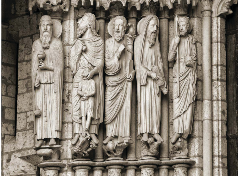
Resim 7: Chartres Katedrali, Our Lady, Notre Dame, Fransa

Ortaçağ Avrupa sanatında da mitolojinin etkileri görülmektedir. Rölyef ve heykellerde Antik Yunan sanatındaki öyküleyici kompozisyon ve anlatım dili hakimdir. Hıristiyanlığı yayma ve koruma gibi bir misyona sahip olan Ortaçağ heykel ve rölyeflerinde mitoloji, dinsel metinlerin tasvirleri olarak karşımıza çıkmaktadır. Buna bağlı olarak da pagan kültürünün hakim olduğu ilkel çağlardaki mitolojik kahramanlar İncil’de yeni karakterlere dönüşmüştür. “Ortaçağ, Antikitenin veya egzotizmin geniş repertuarlarından da hiç vazgeçmemiş, hayal gücünü uzun süre bunlardan beslemiştir. Cehennem devrelerinin, masalsı varlıkların yeniden doğumları, hayvan öykülerinde, el yazmalarının kenar süslerinde veya yontu dekorlarında giderek artmakta ve tamamen yapay koskoca bir dünyanın, yaşayan dünyanın içine dâhil edilmesi, bu oluşumun ilk aşamasını tanımlayan tema ve ilkelerin birliğini sarsmaktadır. Bunlar aynı zamanda, fantezileri ve efsaneleri her zaman beslemiş olan klasik antikite ve Doğu kaynaklarını da yeniden canlandırmaktadırlar.” 17