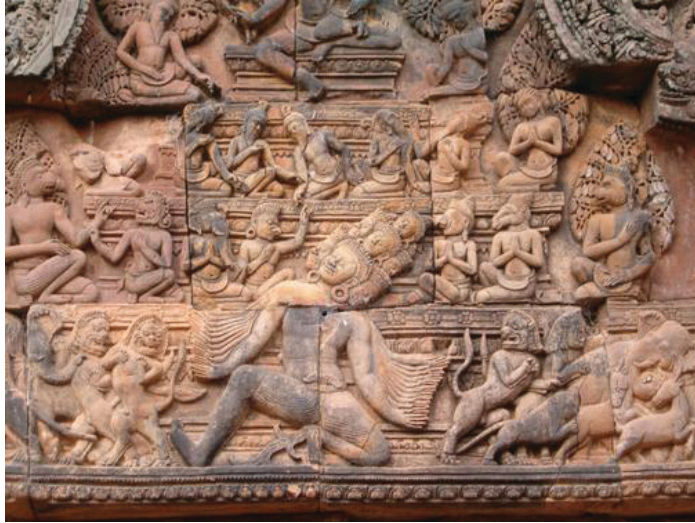
Resim 5: Ramayana Destanından Bir Sahne

M.Ö. 3000'lerde İndus Vadisi'nde kurulan Hindistan; Mısır ve Mezopotamya ile eş zamanlı uygarlıkların oluştuğu merkezlerden biridir. Uzakdoğuyu temsil eden bütün dinsel ve mitsel anlatıların kaynağı Hindistandır. Yaşama ilişkin tüm fenomenler ve inanışlar, mitos ve dinler tarafından çevrelenmiştir. Bu mitoslar ve inanışlar ilk çağ uygarlıklarının aksine günümüzde de yaşamın bir parçası olarak varlıklarını sürdürmektedir. 13