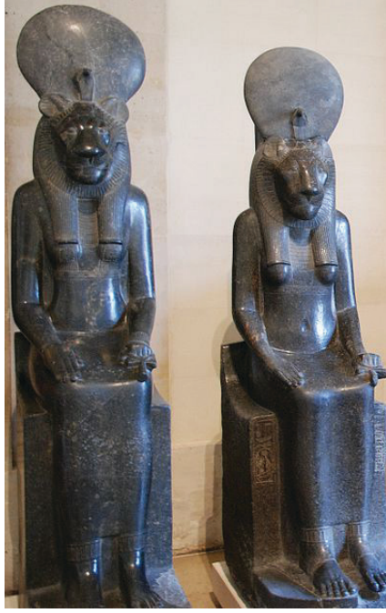
Resim 3 : Sekmet, Louvre Müzesi

armağanlarını koca bir külah içinde sakladı. Sakladı ama onun saçlarını kesen berber sonunda kulaklarını gördü. Kulakları gördüğünü kimseye söylemeyeceğine yemin etti. Berber bu, konuşmadan durur mu, gitti bir çukur kazdı sazların arasında, usulca “Kral Midas’ın kulakları eşek kulakları ” diye fısıldadı. Aradan zaman geçti. Çukurun çevresinde büyüyen sazlar yel estikçe “Kral Midas’ın kulakları eşek kulakları!” diye bağırmaya başladılar. Böylece herkes gerçeği öğrendi.” 7