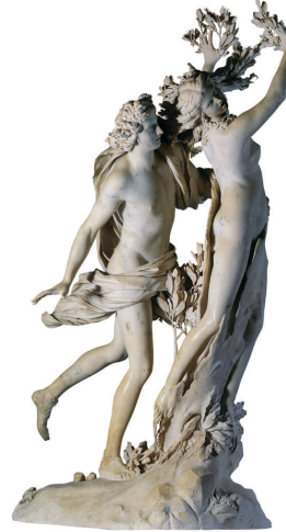
Resim 9: Apollo Daphne, Bernini

Apollo ve Daphne isimli heykelinde esin kaynağı Yunan mitolojisidir. Eros’u kızdıran Apollo, Eros tarafından cezalandırılır. Eros hazırladığı iki oktan aşık eden altın oku Apollon’un kalbine, nefret ettiren kurşun oku da Daphne’nin kalbine atar. Sonuç olarak Apollon aşık olduğu Daphne’nin peşinden koşup dururken Daphne kaçır ve tam yakalanacağı sırada Apollon’dan kurtulmak için ırmak ve deniz tanrısı babasından yardım ister. Bir defne ağacına dönüşerek Apollon’dan kurtulur. 19