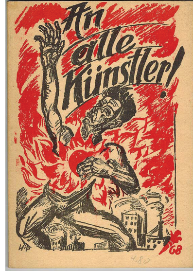
Resim 14. Kaethe Kollwitz, Asla Tekrar Savaş, 1924, Litografi

çağırıldığı “An alle Künstler” (Bütün Sanatçılara) adlı litografi eseri ile, Kollwitz’in en tanınmış grafik çalışmalarından biri olan ve son senelerde içeriğiyle yine aktüel olan “Nie wieder Krieg” (Asla Tekrar Savaş) adlı litografik afişi, kompozisyon bakımından birbirlerine çok benzemektedir. 18 Litografi, siyahtan beyaza kadar sınırsız gri tonlama ve renkli baskının çok varyasyonlu renk çeşitleme olanaklarıyla ekspresyonist sanatçılar için kendini ifade etmede önemli bir araç olmuştur. Yine bu dönemde sosyal mesajlar içeren afişler oldukça yaygındı. Litografi tekniği, yazı ve imge kombinasyonunun birlikte işlendiği resim ve afiş çizimlerinde sanatçıya, yükseltti farkı olmayan düz bir satıh (litografi taşı) üzerinde, kağıda çalışır gibi çalışma ve istediği etkiyi yakalama konusunda büyük kolaylıklar sağlıyordu. Ancak o dönem oluşan ekspresyonist grupların çalışma düzenlerine bakıldığında baskıresim tekniklerinin tercihi konusunda da ayrışmalar olduğu görülür.