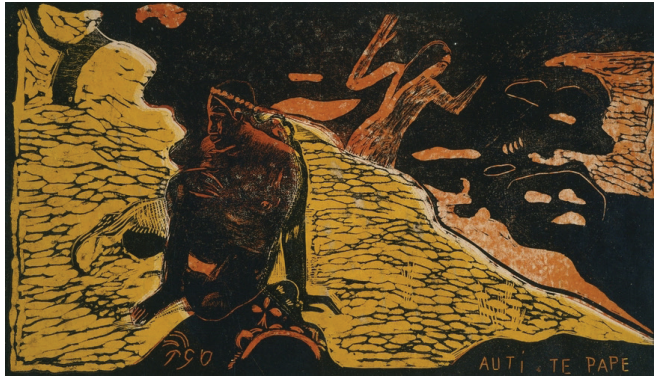
Resim 2. Paul Gauguin, Auti Te Pape, 1893-1894, Karışık Teknik, (Ağaç Baskı, Gravür, Şablon Baskı)

Alman ekspresyonistleri, geçmişteki sanat ve sanatçıları inceleyip yeni tekniklerle farklı bir anlatım dili ortaya koymaya başladılar. 20 yüzyıl başında özgün baskının çoğaltma imkanlarını grafiksel bir dille bütünleştirerek içsel duygu ve düşüncelerini halka ulaştırmayı ve gelecek kuşaklara aktarmayı başardılar. Uzak kültürlerin sanatı ve ilkelci yaklaşım bu dönem sanatçılarının en önemli öğesidir. Afrika kültürlerinin ahşap yontuları, Pasifik adalarının sanat yapıtları, Okyanusya maskeleri ve eski Alman resim sanatı ekspresyonistlerin ilham kaynağı olmuştur.