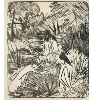
Resim 8. Otto Müller, Waldsee, Litografi

Baskı tekniklerine dayalı grafiksel anlatım dili bu sanatçıların ortak çalışma ve sanatsal etkileşimleriyle zenginleşmiştir. "20. yüzyılda bu grupla sanat tarihinde gerçek yerine ve diline kavuşan özgün baskı sanatı, sonrasında gittikçe zenginleşecek bir akım yada grubun ortak çalışmalarından öte kişilerin ifade ve sanat dili olacaktır." 10 Başlarda, tahta baskı tekniğiyle ilgilenen sanatçılar çoğunluktadır. Tahta baskı, dışavurumcu ifade tarzına uygun biçimleri ortaya çıkarma ve geleneksel olanın yaşatılması hususunda bu sanatçılar için önemli bir rol oynamıştır. Yanı sıra, Gutenberg'ten üç buçuk asır sonra Senefelder'in 1796'da icadıyla, matbaanın yeniden doğuşu ve kimyasal özellikleriyle yeni bir baskiresim tekniği olan litografi (taş baskı), tahta baskı kadar eski bir geleneğe sahip olmasa da, baskı ülkesi Almanya'dan kısa sürede bütün dünyaya yayılarak gelenekselleşmiştir. Köprü grubunun kuruluşundan kısa bir süre sonra 1906'da hızla yaygınlaşan ticari litografi atölyeleri ve çalışanlarının haklarını savunmak amacıyla "Alman Taşbaskı Ustaları Birliği" kurulmuş 20 farklı şehirden yaklaşık 160 firma