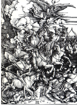
Resim 1. Albrecht Dürer, Mahşerin Dört Atlısı, 1496-1498, Ağaç Baskı

ölçüde yön vermiştir.” 4 Sanayileşmenin sosyal sorunları sonucu dışavurumcu anlayış her ne kadar kuzey Avrupa ve Paris’te ortaya çıkmışsa da büyük savaşlardan ve toplumsal değişimlerden geçmiş Alman toplumunda asıl kişiliğini bulmuştur. I. Dünya savaşı öncesi ve sonrasında toplumsal, siyasi ve ekonomik çalkantılarla boğuşan Almanya’da dışavurumcu sanatın en güçlü eserlerinin ortaya çıkması tesadüf değildir. Hayatın koca dişlileri arasına sıkışmış insan ruhunun sesiz çığlıkları, Alman dışavurumcu sanatında görünür olmuştur. 5 Almanya’nın yoksul ve işçi sınıfı insanların yaşantısı, haksızlıklar, yolsuzluklar, toplumun barış ve huzuruna yönelik konular o dönem ekspresyonist baskiresimlerinin ana konusu olmuştur.