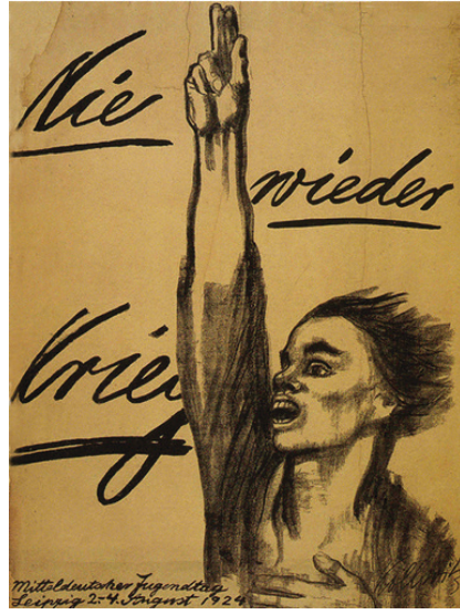
Resim 13. Max Pechstein, Bütün Sanatçılara, 1918, Litografi