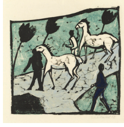
Resim 5. Erich Heckel, 1912