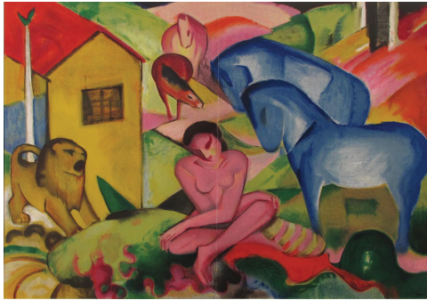
Resim 15. Franz Marc, Rüya, 1912, 1962’de Paris’te Mourlot’un aynı adlı tablodan çoğalttığı renkli litografi (ortadan katlanmış)

çağırıldığı “An alle Künstler” (Bütün Sanatçılara) adlı litografi eseri ile, Kollwitz’in en tanınmış grafik çalışmalarından biri olan ve son senelerde içeriğiyle yine aktüel olan “Nie wieder Krieg” (Asla Tekrar Savaş) adlı litografik afişi, kompozisyon bakımından birbirlerine çok benzemektedir. 18 Litografi, siyahtan beyaza kadar sınırsız gri tonlama ve renkli baskının çok varyasyonlu renk çeşitleme olanaklarıyla ekspresyonist sanatçılar için kendini ifade etmede önemli bir araç olmuştur. Yine bu dönemde sosyal mesajlar içeren afişler oldukça yaygındı. Litografi tekniği, yazı ve imge kombinasyonunun birlikte işlendiği resim ve afiş çizimlerinde sanatçıya, yükseltti farkı olmayan düz bir satıh (litografi taşı) üzerinde, kağıda çalışır gibi çalışma ve istediği etkiyi yakalama konusunda büyük kolaylıklar sağlıyordu. Ancak o dönem oluşan ekspresyonist grupların çalışma düzenlerine bakıldığında baskıresim tekniklerinin tercihi konusunda da ayrışmalar olduğu görülür.