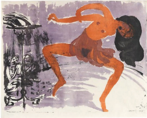
Resim 9. Emil Nolde, Dansçı, 1913, Litografi

Köprü grubunun isim babası ve kurucularından, Karl Schmidt-Rottluff manzara ve nü resimleriyle ünlü bir ressamdı ve litografiyi ustaca kullanıyordu. Grubu da litografiyle kendisi tanıştırmıştır. Otto Müller de bu dönemde yetkin bir litografi ustasıdır. “Die Brücke” grubuna 1910 yılında giren sanatçı, litografiyi meslek okulunda öğrenmiş, Görlitz’de dört yıl litografi atölyesinde çıraklık yapmıştır. 1927 yılında bastırılan “Çingenelerin Toplu Eserleri” adlı grafik dizisi en sevdiği konudur. Çoğu renkli litografiden oluşan 160 eseri sınırlı sayıda basılmıştır.” 12 Grubun kuruluşundan sadece iki yıl kadar sonra, Rottluff’un yanı sıra Kirchner ve Erich Heckel gibi sanatçılar da çoğunlukla litografik eserler üretmişlerdir. Sert kontür çizgileri ve zıt renkleri etkili biçimde kullanarak, kızgın ve sinirli bir çizim üslubuyla parçalanmış biçimler yaratan Kirchner, dışavurumculuğun en uç örneklerini litografi tekniğine de uygulamıştır. Die Brücke’nin kurucularından Heckel, ekspresyonistler içinde lirik temalarıyla öne çıkan bir sanatçıdır. Etrüsk sanatından, Afrika heykellerinden ve Van Gogh’tan etkilenir. Litografi çalışmalarında, sulu boyadaki başarısını bu tür konuları resmetmede etkili bir şekilde kullanmıştır.