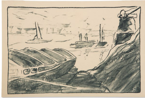
Resim 7. Karl Schmidt-Rottluff, Elbe Limanı, 1907, Litografi