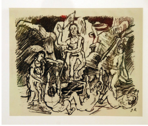
Resim 19. Oskar Kokoschka, Auferstehung (Diriliş), 1916, Litografi

1900'lü yılların başında litografinin, endüstri çağına ayak uydurmasıyla gelişen "ofset lito" teknikleri, çoğu zaman röprodüksiyon olarak görülüp, orijinal kabul edilmemesine ya da yarı orijinal sayılmasına rağmen, dönem sanatçıları tarafından ilgi görmüştür. Empresyonizmde Seurat öncesi, renklerin optik karışımla algılandığı, puantist anlayışa gelene kadar, litografide genellikle tek rengin tonlamalarıyla sanatsal baskı yapılıyordu. Orjinallik tartışmalarına karşın, "endüstriyel perfeksiyon" renkli kalıp hazırlamada, o zamana kadar çıplak gözle yapılan, renk ayırımı işlemini kolaylaştırmıştır. 24 1816'da Engelmann tarafından icat edilen