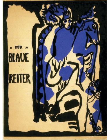
Resim 16. W. Kandinsky, Mavi Süvari, Yıllık, 1912, Ağaç Baskı

1911 ile 1914 yılları arasında “Köprü” sanatçıları kadar bağları kuvvetli olmasa da Paul Klee, Heinrich Campendonk, August Macke gibi dönemin ünlü sanatçılarını bünyelerine katarak yapıtlarını ortak sergileyen esnek bir örgüt niteliğinde genişleyerek ekspresyonist tarzda eserler ürettiler.