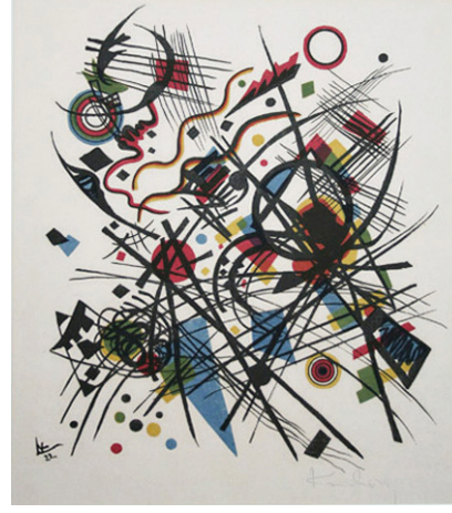
Resim 18. Wassily Kandinsky, 4. Bauhaus Dosyası'ndan, 1922, Litografi

von Jawlensky, August Macke, Gabriele Münter, Marianne von Werefkin, Lyonel Feininger, Christian Rohlf, Oscar Kokoschka, Max Beckmann, George Grosz ve Otto Dix gibi sanatçılar da Alman ekspresyonizmi çerçevesinde dışavurumcu grafiği, özgün baskıdaki (litografi, gravür, tahta baskı) başarılarıyla boyaresim düzeyine çıkarmışlardır. Grosz'un baskıları daha çok yayımcılığa yöneliktir. Sosyalist bir düzen kurma hevesiyle çizgisel karikatür ve mizah grafiği içeren litografileri çoğunluktadır. Kitlelere ulaşmak amacıyla savaş sonrasında bastığı taşbaskılarına “Politik Ders Kitapları” adını vermiştir. Alman ekspresyonizminin grafiği bir anlatım dili olarak kullanan en yetkin sanatçılarından Beckman çizgisel, karikatürize çalışmalarında grafik mizahı da başarıyla kullanmıştır.”Taşbaskılarındaki kesin biçimsel örgü sanki resimlerinin izlerini taşımaktadır.” ,