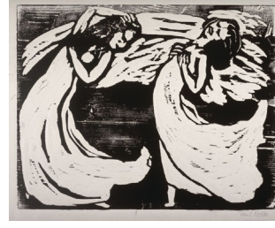
Resim 6. Emil Nolde, 1917

1905'te kurulan "Die Brücke" (Köprü), Alman resim sanatında önemli bir yere sahiptir. Dresden'de Karl Schmidt-Rottluff, Ernst Ludwig Kirchner, Erich Heckel ve Fritz Bleyl adlarında, teknik üniversitede mimarlık okuyan dört yenilikçi genç tarafından kurulmuş sanatçılar birliğidir. 9 1913'e kadar yaklaşık 70 üyesi olan bir sanatsal kurum haline gelmiştir. "Köprü" adı başlangıçta modern sanatın çeşitli dallarında eser veren sanatçılar arasındaki bağı simgelemektedir. Daha sonra bu anlam derinleşmiş, grup sanatçıların geleceğin sanatına olan inançları ve bu inançla üretilen yapıtların geleceğe bağ kurması anlamında kullanılmıştır.