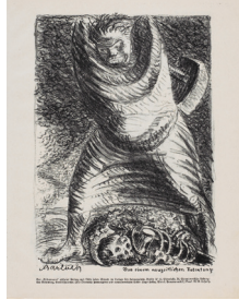
Resim 11. Ernst Barlach