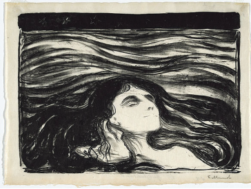
Resim 10. Edward Munch

Litografi tekniğinin anavatanı Almanya’da, Alman ekspresyonizminin öncülerinden Ambroise Vollard da kendi dönemindeki sanatçıları ve basımevlerini etkilemiştir. “Vollard, aynı dönemde, hem teknik hem de sanatsal açıdan mükemmel nitelikte kitaplar ve dosyalar basmıştır.” 16 Alman ekspresyonist sanatçıların litografiye yönelmesinde, Fransız sanatçıların özellikle de Leutrec’in büyük etkisi olmuştur. Litografi, Max Liebermann, Lovis Corinth, Max Beckmann, Ernst Barlach, Kaethe Kollwitz, Max Slevogt ve Oscar Kokoschka gibi ünlü sanatçılar için de dışavurumda yeni bir grafiksel anlatım biçimi olmuştur.