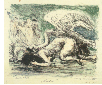
Resim 12. Lovis Corinth

Ludwig Kirchner ve Max Pechstein gibi ekspresyonist birçok sanatçı, baskiresimde rengi savunuyorlardı. Hiçbir ekolün üyeliğini kabul etmeyen Almanya’nın en tanınmış kadın ressamı “Kaethe Kollwitz daha okul yıllarındayken grafik sanatında rengin kullanılmasını eleştirip, siyah-beyazın daha farklı bir etki yakalayacağını ve hisleri daha çok heyecanlandıracağını söylüyordu. Böylelikle hayatın karanlık noktalarının daha iyi anlatılabileceğini ve mesajın daha büyük kitlelere ulaşabileceğine inanıyordu.” 17