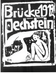
Resim 4. Otto Müller, 1912