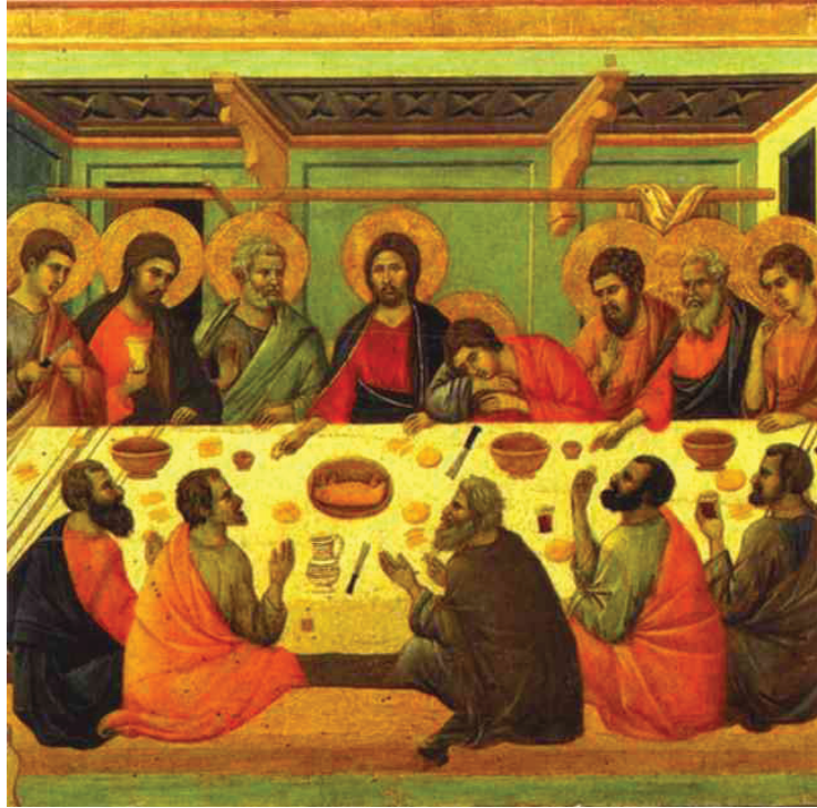
Tablo 1: Duccio Di Buoninsegna, “LAST SUPPER”, Panel Üzerine Tempera, 50x53cm, 1308-1311

Erken dönemde yapılmış olan “Son Akşam Yemeği” eserlerinde perspektif kurallarının uygulanmadığı daha sonraki dönemlerde uyguladıkları görülmektedir.