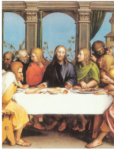
Tablo 6: Hans Holbein/ Younger, “LAST SUPPER”, Panel Üzerine Yağlıboya, 115x97cm, 1524-25

yapıtında sanatçının güçlü bir Flaman etkisinde kaldığı kendini gösterir. Castagno'nun kompozisyon kurgusu ile benzerlik gösterir. Sadece Yuhanna figürü Castagno'da sol tarafta arkası dönük olarak masa düzleminin ön tarafında yer alırken Ghirladaio'nun eserinde ise sırtı sağ tarafa dönük olarak yerleştirilmiştir. Arka plandaki mimari yapılarla yapıtta derinlik elde edilmeye çalışılmıştır. Castagno'nun aksine Ghirladaio'da arka planda yer alan mimari formların içerisinde iki boyutlu olan bu düzlemde üç boyutlu derinlik yaratılması için manzaralara yer vermiştir. Eserde orta merkeze asıl figürü yerleştiren sanatçı yanlardaki figürlerle resmi orta merkeze çekmektedir. z.ısa'nın her iki yanındaki havari grupları etkili biçimde düzenlenmiştir. Gombrich'e göre “Ghirlandaio, figür gruplarını etkili bir biçimde düzenlemeyi ve hoş bir görüntü yaratmayı biliyordu (GOMBRICH, 1997:304) ”.