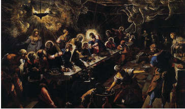
Tablo 8: Tintoretto, “LAST SUPPER”, Canvas, 365x568cm, Venice, San Giorgio Maggiore, 1592-94

Juan De Juanes Vicente İspanyol Rönesans sanatçısıdır. Eserlerinde genellikle dini konuları işlemiştir. “Son Akşam Yemeği” adlı eserinde sanatçı Hz. İsa’yı Rönesans’ın geleneksel kompozisyon ilkesine uyararak tam orta merkeze yerleştirmiş ve Leonardo’daki gibi arkasında açıklık bırakarak derinlik etkisi vermeye çalışmıştır. Böylece gözü ilk olarak orta merkeze toplamıştır. Resim düzleminde ön kısımda büyük ebatta sürahi ve leğen yerleştirmiştir. Genel olarak tüm Rönesans sanatçıların uyguladığı kapalı kompozisyon ilkesine bağlı kalarak masayı resim düzlemine paralel yerleştirmiştir. Figürler bu paralellığe rağmen daha dinamik durmaktadır. Resmin sol tarafında yere çömelmiş elleri ile resmin orta merkezine yöneltmesiyle sanatçının izleyiciyi resimde asıl vurgulamak istediği ana merkeze Hz. İsa figürüne gönderme yapmaktadır. Havarilerin başlarında Gotik dönemde ve Erken Rönesans (Quanttrocento)’ta gördüğümüz hale biçimini çizgisel bir üslupla verdiği görülmektedir.