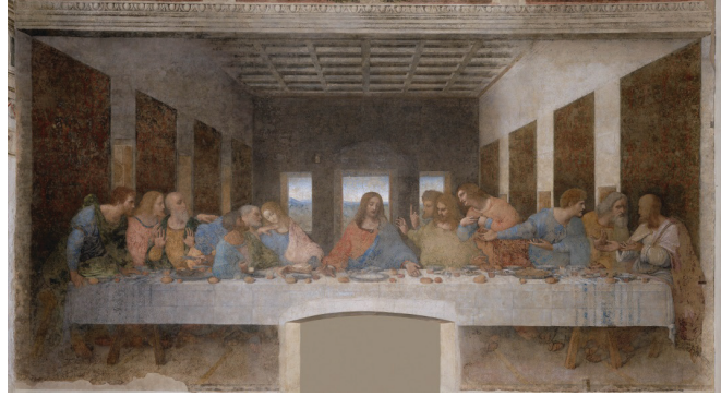
Tablo 4: Leonardo Da Vinci, "LAST SUPPER", Fresko, 420x910cm, Milan Santa Maria Delle Grazie, 1495-98

olduğu izlenmektedir. Yapıttaki figürlerde Gotik'in sert ve katı formu gözükmemektedir. Bunun nedeni sanatçının Kuzey Rönesans sanatçısı olmasından dolayıdır. Kuzey Rönesans'ın erken dönem şiirselliği arka planda kendini göstermektedir. İç mekân ayrıntılı bir şekilde ele alınmış mekân resim yüzeyine doğru açılmıştır.