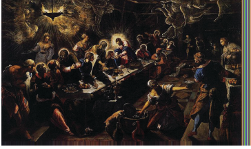
Tablo 7: Juan De Juanes Vicente, “LAST SUPPER”, Panel Üzerine Yağlıboya, 116x191cm, Museo Del Prado, 1560

Wölffine göre; “ Holbein için renk, hemen hemen maddi bir gerçekliği olan ve bütün değerini kendinde taşıyan güzel bir madde idi. Işıklı ve gölgeli yerlerdeki belirli ayrılıklara rağmen renk, aslında hep aynı kalmaktaydı (WÖLFFLIN, 2000:67)”.