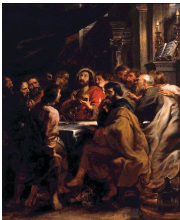
Tablo 9: Peter Paul Rubens, “LAST SUPPER”, Panel Üzerine, 304x250cm, 1632