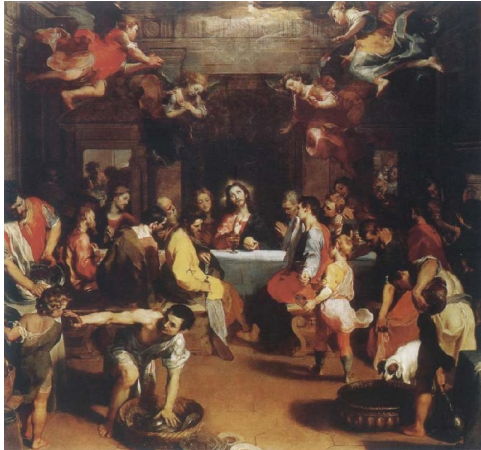
Tablo 11: Federigo Barocci, “LAST SUPPER”, 300x318cm, Urbino Katedrali

Tiepolo’nun “Son Akşam Yemeği” adlı yapıtı Leonardo’nun “Son Akşam Yemeği” eseriyle üslup yönünden tamamıyla tersini temsil etmektedir. Bu yapıtta figürler aynı düzlemde sıralanmış değildir. Dağınık bir kompozisyon vardır.