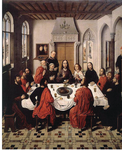
Tablo 3: Dieric Bouts, "LAST SUPPER", Ahşap Üzerine Yağlıboya, Leuven, 1464-67

Flemenk ressam Dieric Bouts (1410-1475), Kuzey Rönesans sanatının özelliklerini taşımaktadır. Leuven altarındaki "Son Akşam Yemeği" yapıtında sanatçı doğru bir perspektif kullanmış figürlerin yerleştirilmesinde ki sorunları çözmüştür. Bouts bu yapıtında figürleri ve dekoru paralel yerleştirme ilkesine bağlı kalarak kullanmış