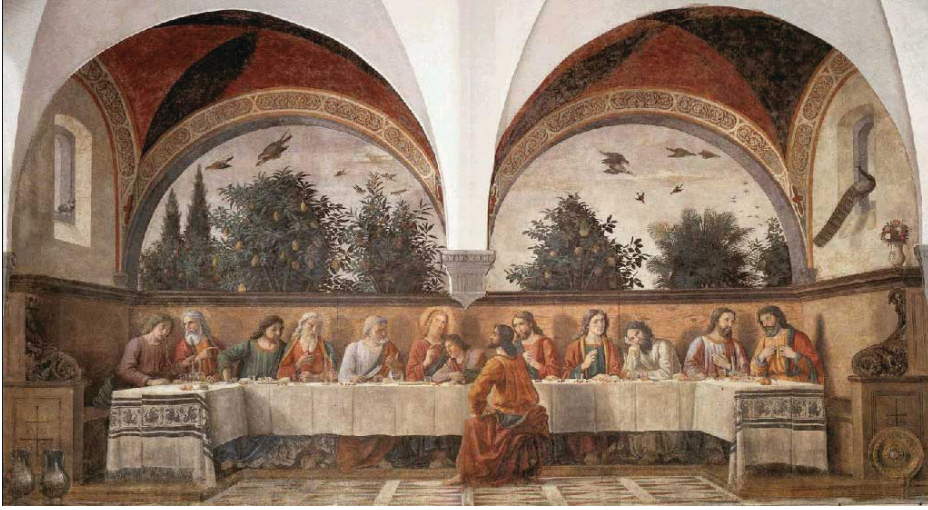
Tablo 5: Domenico Ghirlandaio, “LAST SUPPER”, Fresko, 400x880cm, Ognissanti Kilisesi, 1480 5: Domenico Ghirlandaio, “LAST SUPPER”, Fresko, 400x880cm, Ognissanti Kilisesi, 1480

yapıtında sanatçının güçlü bir Flaman etkisinde kaldığı kendini gösterir. Castagno'nun kompozisyon kurgusu ile benzerlik gösterir. Sadece Yuhanna figürü Castagno'da sol tarafta arkası dönük olarak masa düzleminin ön tarafında yer alırken Ghirladaio'nun eserinde ise sırtı sağ tarafa dönük olarak yerleştirilmiştir. Arka plandaki mimari yapılarla yapıtta derinlik elde edilmeye çalışılmıştır. Castagno'nun aksine Ghirladaio'da arka planda yer alan mimari formların içerisinde iki boyutlu olan bu düzlemde üç boyutlu derinlik yaratılması için manzaralara yer vermiştir. Eserde orta merkeze asıl figürü yerleştiren sanatçı yanlardaki figürlerle resmi orta merkeze çekmektedir. z.ısa'nın her iki yanındaki havari grupları etkili biçimde düzenlenmiştir. Gombrich'e göre “Ghirlandaio, figür gruplarını etkili bir biçimde düzenlemeyi ve hoş bir görüntü yaratmayı biliyordu (GOMBRICH, 1997:304) ”.