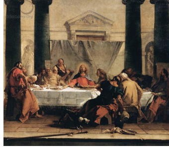
Tablo 10: Giovanni Battista Tiepolo, “LAST SUPPER”, Tuval Üzerine Yağlıboya, 90x80cm, Louvre Müzesi, 1745-50

resmin tümü algılanmaktadır.16.yy’da resim düzlemler üzerinde toplanırken 17.yy’da yerini derinlemesine kompozisyona bırakmıştır. Wölffine göre; “16.yy’da bütün dikkat sahnenin önüne paralel, birbiri ardına sıralanan düzlemlere çevriliyken 17.yy.’da gözü bu arka arkaya düzlemlerden kurtarmaya,onları değerden düşürmeye ve görülmez hale getirmeye çalışmıştır (WÖLFFLIN, 2000:90)”. Bu yapıt kapalı kompozisyondan açık kompozisyona, çizgisellikten gölgesellige, mutlak belirlilikten mutlak belirsizliğe, düzlemsellikten derinselliğe geçildiğinin bir kanıtıdır.