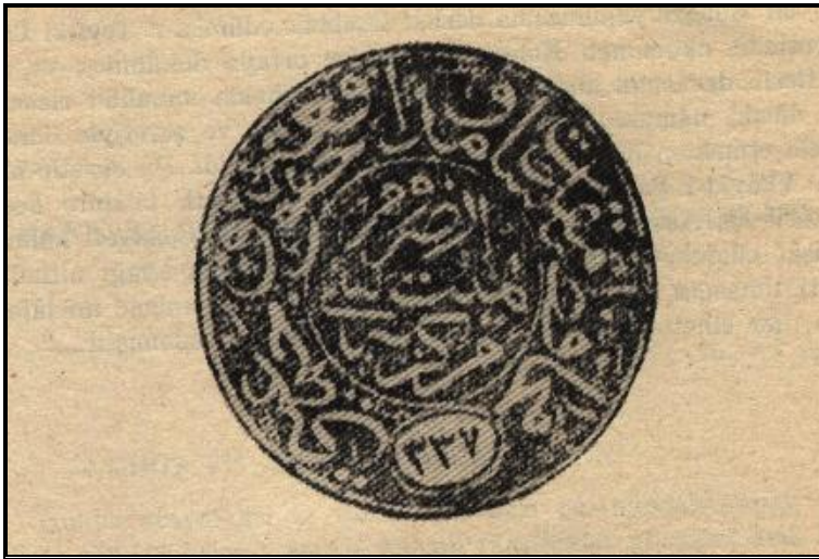
Muhâfaza-i Mukaddesât ve Müdâfaa-i Hukuk Cemiyeti ( Erzurum Heyet-i Merkeziyesi-337 ) Yazılı Mühürü