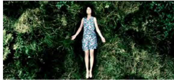
Görsel 2: Melancholia (Justine)