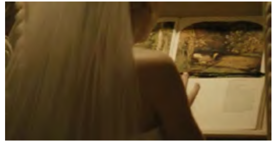
Görsel 8 & Görsel 9: Justine süprematizm akımına ait resimleri kaldırarak yerlerine Karda Avcılar ve Ophelia'yı koyar.

İnsanlık, bugün inanıldığı gibi daha iyiye ya da daha güçlüye ya da daha yükseğe doğru bir gelişme göstermemektedir, "ilerleme" modern bir düşüncedir yalnızca, yani, yanlış bir düşünce. Bugünün Avrupalısı, değerlilik bakımından, Rönesans Avrupalısının fersah fersah altında kalır; ileriye doğru gelişme, herhangi bir zorunlukla, yükselme, yücelme, güçlenme değildir hiç de. (Nietzsche, 2005: 7)