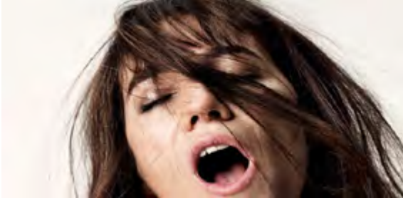
Görsel 3: Nymphomaniac (Joe)