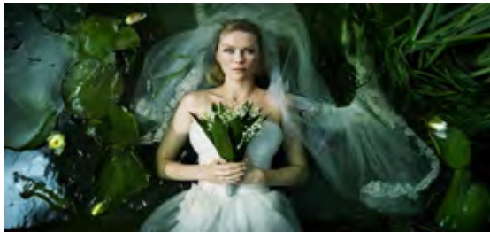
Görsel 1: Antichrist (Filmde isim belirtilmiyor)