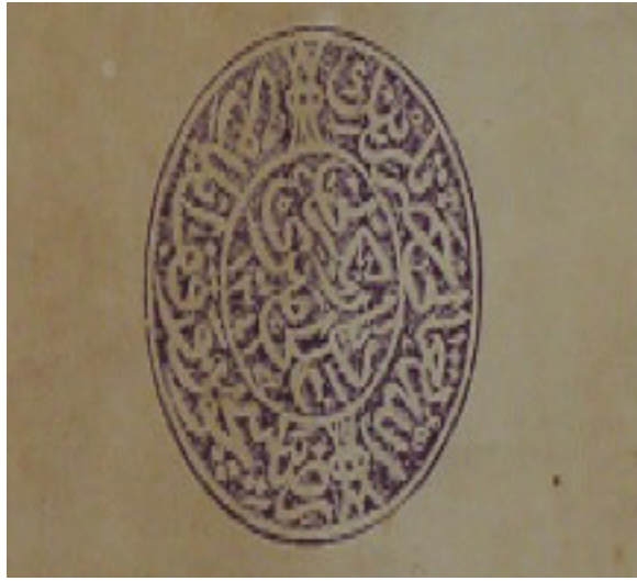
Ek 5: Eserin üzerinde yer alan Ali Emiri'ye ait temellük mührü