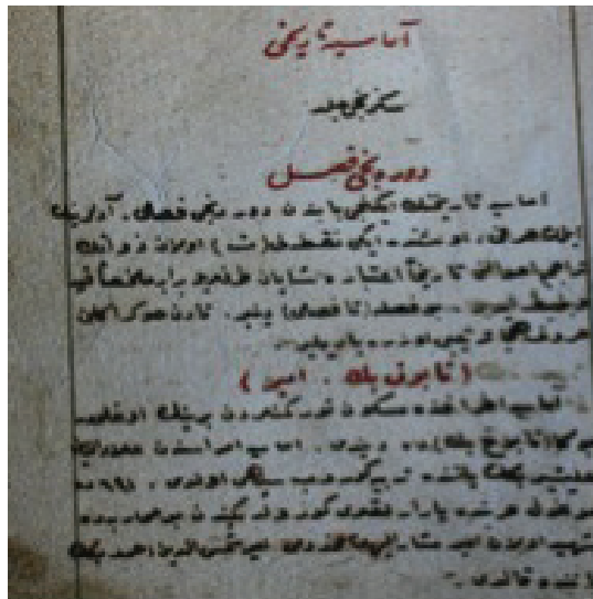
Ek 2: Amasya Tarihiden bir sayfa