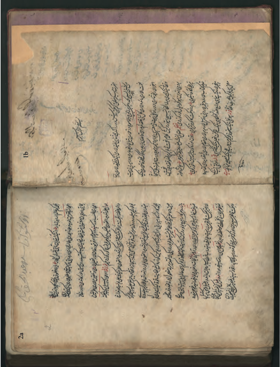
Ek 2: T Nüshası 1b, 2a (Eserin giriş bölümü)