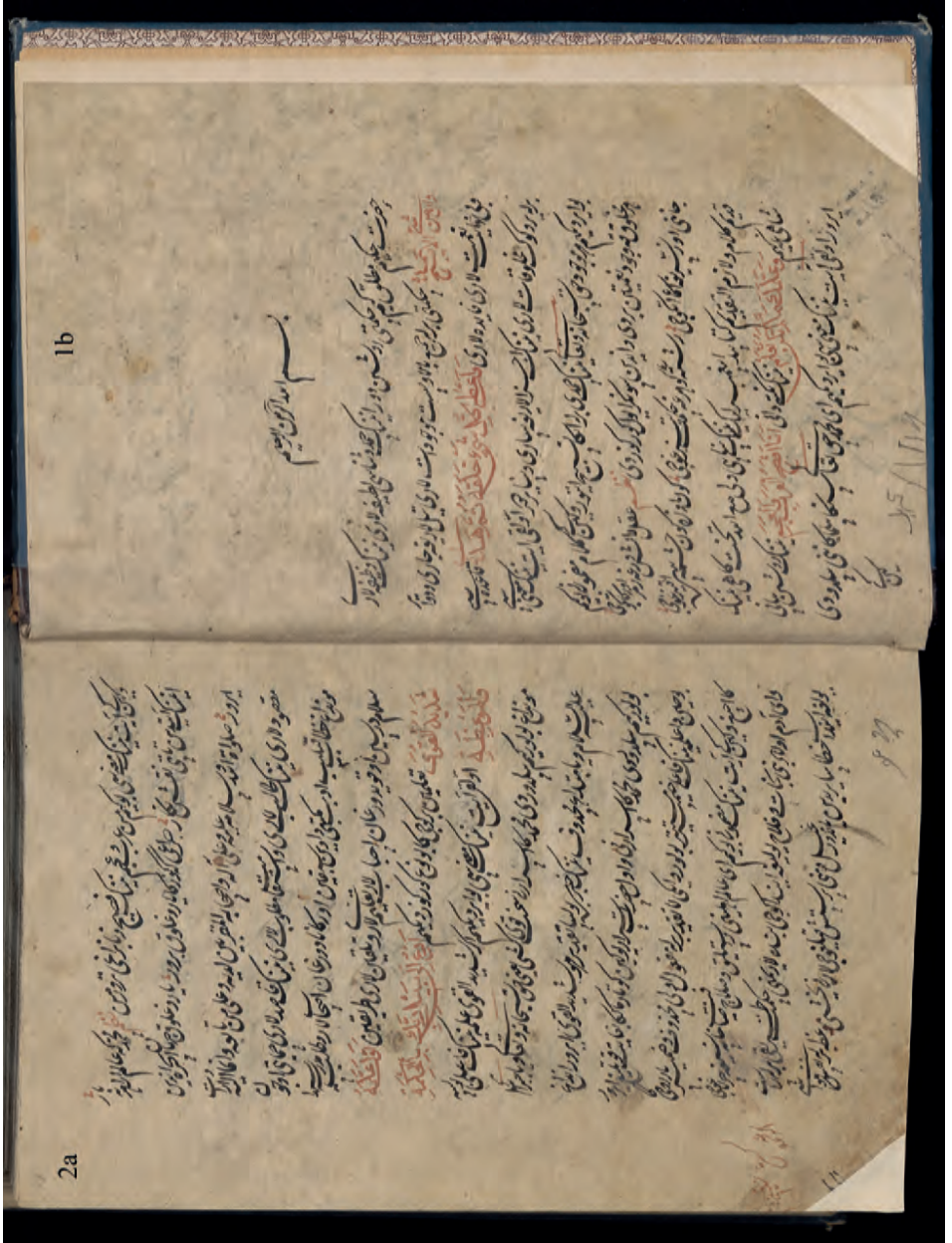
Ek 1: L Nüşhası 1b, 2a (Eserin giriř bölümü)