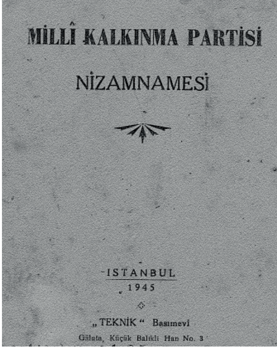
EK 1: Milli Kalkınma Partisi Nizamnamesi'nin 1945 tarihli nüshasının kapağı.