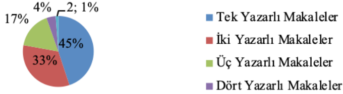
Grafik 2. DED’de yayımlanan makalelerin yazarlık durumlarının yüzdelik dağılımı

Yukarıdaki tablo ve grafikte DED’de yayımlanan makalelerin yazar kadrolarına ilişkin bilgiler sunulmaktadır. Bulgulara göre 75 makalenin tek yazarlı, 55 makalenin iki yazarlı, 28 makalenin üç yazarlı, 7 makalenin dört yazarlı, 2 makalenin ise beş yazarlı olduğu görülmektedir. Genel bir değerlendirme yapıldığında makalelerin %45’inin tek yazarlı, %55’inin iki ve daha fazla yazarlı olduğu anlaşılmaktadır.