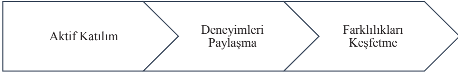
Şekil 2. Yaratıcı Dramanın Etkileri

Öğrencilerin kendi kültür ve inanç dünyalarına ait olmayan ve yeni karşılaştıkları bilgileri drama aracılığıyla öğrenirken içeriden bir bakış açısı kazandıkları görülmüştür. Bununla ilgili olarak K13 ‘Hıdırellezde yapılan şeyler çok güzeldi daha önce hiç görmemişim bundan sonra Hıdırellez kutlayanları görsem ben de yanlarına giderim hemen.’ demektedir. Ritüellerin canlandırma ve rol yapma ile uygulamalı bir biçimde aktarılması öğrenmenin daha hızlı ve kalıcı olmasını sağlarken her ne kadar kendi kültüründen farklı da olsa ileride ritüele katılım olasılığını da canlı tutmaktadır. K14 ise durumu farklı bir bakış açısıyla şu şekilde anlatmaktadır: ‘Diğer arkadaşlarımızın bayramlarda farklı şeyler yaptığını öğrendim. Yani onların gelenekleri farklıymış ama yine de aslında aynı şeyi kutluyoruz.’ Katılımcının ifadesi aynı kültür içinde yer alıyor olsa bile küçük farklılıkların keşfedilmesinde dramatik uygulamaların önemini vurgulamaktadır.