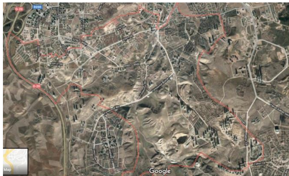
Şekil 4. Ankara ili Çankaya ilçesi Alacaatlı mahallesi uydu görünümü (Google Maps 2019).

TÜİK kırsal alan ölçütü dikkate alındığında, Şekil 3’de görüldüğü gibi, 2013 öncesinde köy olarak kayıtlarda geçen Alacaatlı Mahallesi, Ankara’nın Çankaya ilçesinin kentsel alan sıfatını hak eden altı mahallesinden biridir. Ancak Ankara’nın en eski ve merkezi mahalleleri arasında yer alan Ayrancı ve Bahçelievler gibi mahalleleri yine Şekil 3’teki verilere göre kırsal alan statüsünde değerlendirilmek durumundadır. Oysa aynı mahallelere ait yerleşim yoğunlukları Şekil 4 ve Şekil 5’te sunulmuş uydu görüntülerinde net olarak gözlemlenebilmektedir.