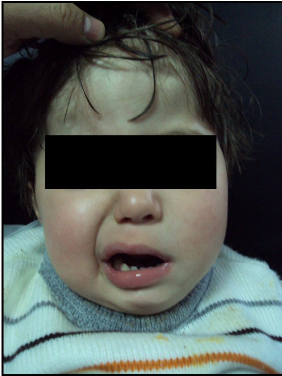
Resim 2. Olgunun yüzünde asimetri ve sol nazolabiyal olukta silinme ile santral 7. sinir felcinin görünümü.

Laboratuvar incelemelerinde, ortalama lökosit sayısı 17205 \pm 8561/\text{mm}^3 , ortalama C-reaktif protein (CRP) değeri 60 mg/dL (3-206 mg/dL) ve ortalama eritrosit sedimentasyon hızı (ESH) 29.40 \pm 16.60 mm/saat idi. Dört hastada (%20) lökositoz yoktu. Üç hastada (%15) CRP değeri <5 mg/dL ve 6 hastada (%30) ESH değeri 20 mm/saat'in altında saptandı. Ondört hastanın (%70) BOS'u bulanık görünümde idi ve lökosit sayısı 500 ile 1500/\text{mm}^3 arasında değişiyordu. Ortalama BOS proteini 129.23 \pm 85.16 mg/dL, ortalama BOS glukoz düzeyi 47.61 \pm 23.15 mg/dL tespit edildi. Üç hastada (%15) BOS glukoz düzeyi, eş zamanlı bakılan kan şekerinin 2/3'ünden daha yüksekti. BOS Gram boyama sonucunda 2 hastada gram pozitif zincirli koklar ve 1 hastada diplokoklar görüldü. BOS kültüründe 4 hastada S. pneumoniae ve 1 hastada ise hem BOS hem de kan kültüründe N. meningitidis üremesi oldu.