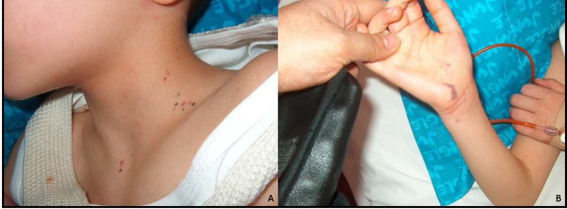
Resim 3. Meningokoksemi tanılı olgunun boyun ön yüz (a) ve avuç içi (b) cildinde maküler ve ekimotik döküntülerin görünümü .

kliniğimize başvurmadan önce antibiyotik tedavisi almalarına bağlı olabileceğini düşünüyoruz.