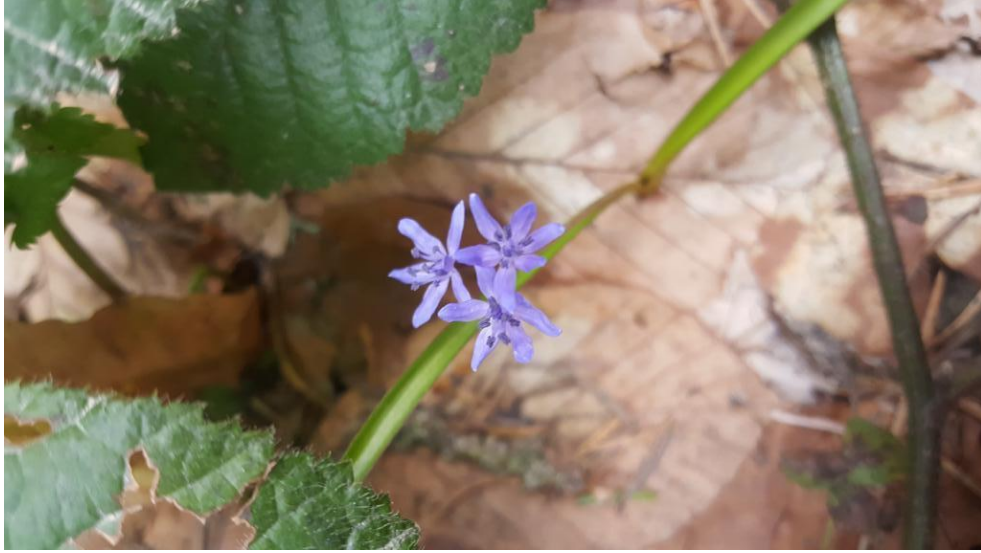
Şekil 3. Scilla bifolia L.'nin genel görünümü ve çiçekleri

Yetiştirme yeri özelliklerine bakıldığında 1400-1710 m rakımlar arasında, göknar, kayın ve çam orman altlarının açıklıklarında, çayır alanlar, kayalık taşlık yamaçlar, orman sınırının bittiği yol kenarı açıklıklarında ve üst rakımlarda karın eridiği eğimli ve düz alanlarda yayılış gösterdiği tespit edilmiştir. Uludağ'ın Akdeniz ve ılıman iklimin etkisinde olduğu alanların yanı sıra üst rakımlara doğru daha yağışlı ve soğuk iklim özelliklerinde de yetiştiği görülmüştür. Türün yetiştirme yerlerinde kırmızı sarı podzolik topraklar-kahverengi orman toprakları, yüksek dağ çayır toprakları ve organik toprakları tercih ettiği gözlemlenmiştir. Uludağ (Bursa)'da doğal yayılış gösteren Scilla bifolia L.'nin bazı morfolojik ve fenolojik özellikleri tespit edilmiş ve bu konuda yapılan benzer çalışmalarla karşılaştırılmıştır (Tablo 3 ve Tablo 4).