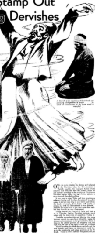
A Dervish of the Whirling Dervish sect, in the middle of a whirling dance, with another Dervish kneeling in front of him.

The Dervishes are a sect of fanatics who practice a form of self-hypnotism and fire-worshipping in secret. They are now being persecuted by the new Turkish republic, though they work for its overthrow and the return of the old rule of the Mohammedan caliphate.