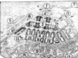
This is the master's plan of the Hoover dam project, which is to be the home of 1,000 workers on the Hoover dam and several thousand on the Colorado canal. The plan shows the dam, the canal, and the city layout. The dam will be 700 feet high and will provide power for approximately 300,000 homes. The city layout is designed to house the workers and their families.

Workers here to build Hoover dam will be housed in a model city. The city will be built on the site of the dam and will be one of the largest cities ever built in the state of Nevada. The city will be designed to house the workers and their families. The city will be built on the site of the dam and will be one of the largest cities ever built in the state of Nevada. The city will be designed to house the workers and their families.