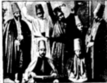
A group of dancing Dervishes in their ceremonial robes, with one in the center performing a ritual.

T HE Dervishes, known as the Whirling Dervishes, are a sect of fanatics who practice a form of self-hypnotism and fire-worshipping in secret. They are now being persecuted by the new Turkish republic, though they work for its overthrow and the return of the old rule of the Mohammedan caliphate.