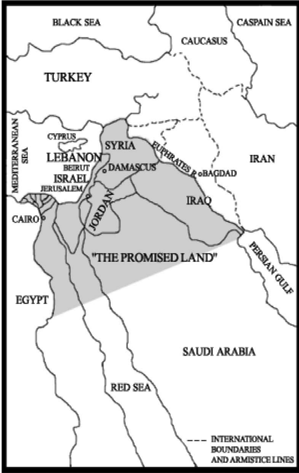
Harita-1: 1904 yılında Theodor Hertzl'in, 1947'de Haham Fischmann'in Tanımlamalarına göre "vaat edilmiş ülke"nin sınırları