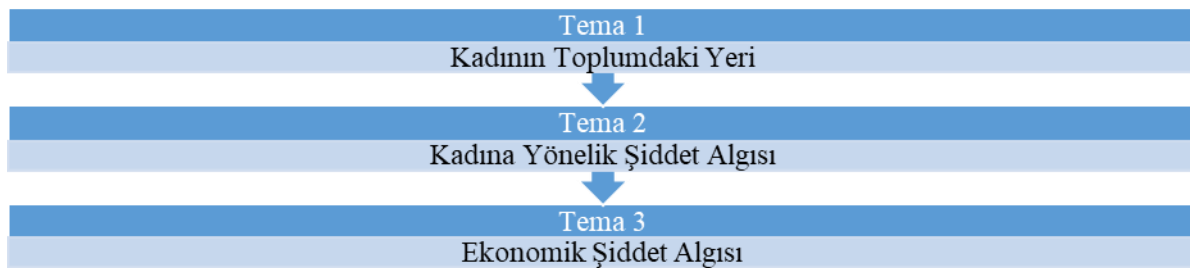
Şekil 1. Temalar ve içerikleri

Şekil 1’de kadın akademisyenlerin kadına yönelik şiddet/ekonomik şiddet olgusunu nasıl anlamlandırdıkları, nasıl izah ettiklerini açıklamak için oluşturulan temalar bulunmaktadır. Tema 1 altında; kadının toplumdaki yerini açıklamak için geleneksel cinsiyet rollerinin nasıl şekillendiği ve toplumun kadının iş gücüne katılımına nasıl baktığı ile kadın akademisyenlerin kadının çalışmasına yönelik tutumları ortaya konulmaya çalışılmıştır. Tema 2 altında; genel olarak kadına yönelik şiddetin nasıl algılandığı ortaya konulmaya çalışılmıştır. Burada kuramsal yaklaşımların etkisi ile çeşitli parametrelere göre şiddet oranının azalıp azalmayacağı üzerinde durulmuştur. Ayrıca şiddete ilişkin toplumsal düzenlemelerin etkileri kadın akademisyenlerin gözünden saptanmaya çalışılmıştır. Tema 3 altında; kadına yönelik ekonomik şiddet olgusu analiz edilmeye çalışılmış, kadın akademisyenlerin bu şiddet türüne maruz kalma durumları irdelenmeye çalışılmış, ekonomik şiddetin artması ya da azalmasında etkili olan faktörler analiz edilmeye çalışılmıştır. Her bir tema altında yer alan kategoriler, görüşmecilerin ortaya koyduğu kavramlardan hareketle olduğu gibi aktarılmıştır.