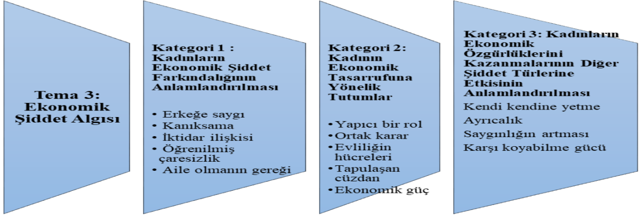
Şekil 4. Tema 3 ekonomik şiddet algısı

Tema 3 başlığı altında ekonomik şiddet algısı 3 farklı kategoride kavramsallaştırılmaya çalışılmıştır. İlk kategoride toplumsal yaşamda kadınların ekonomik şiddet farkındalığının ne seviyede olduğu akademisyenlerin gözünden analiz edilmeye çalışılmıştır. İkinci kategoride, kadınların ekonomik tasarruflarına yönelik tutumlarının nasıl olduğu ve ev içerisinde ekonomik tasarruf hakkının toplumsal cinsiyet bağlamında kimde olması gerektiği gerekçeleriyle ele alınmıştır. Son olarak tema 3 başlığı altında kadınların ekonomik özgürlükleri ile diğer şiddet türlerinin azalıp artmasında nasıl bir ilişkinin olduğu sorgulanmıştır.