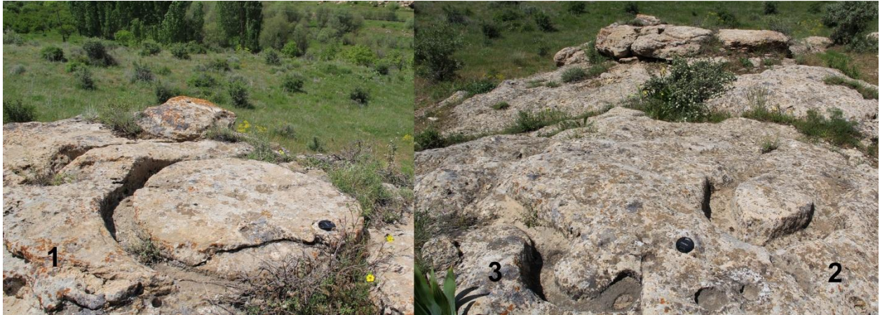
Şekil 4. Agsal kaya işaretleri (Elmar Bahşeliyev / Veli Bahşeliyev). Fig. 4. Rock art in Agsal (Elmar Bakhshaliyev / Veli Bakhshaliyev).