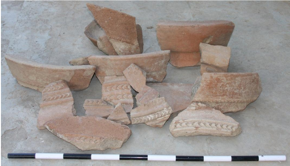
Şekil 8. Sitadel'den bulunan depo kaplarının parçaları (Lauren Ristvet). Fig. 9. Fragments of economic jar from sitadel (Lauren Ristvet).