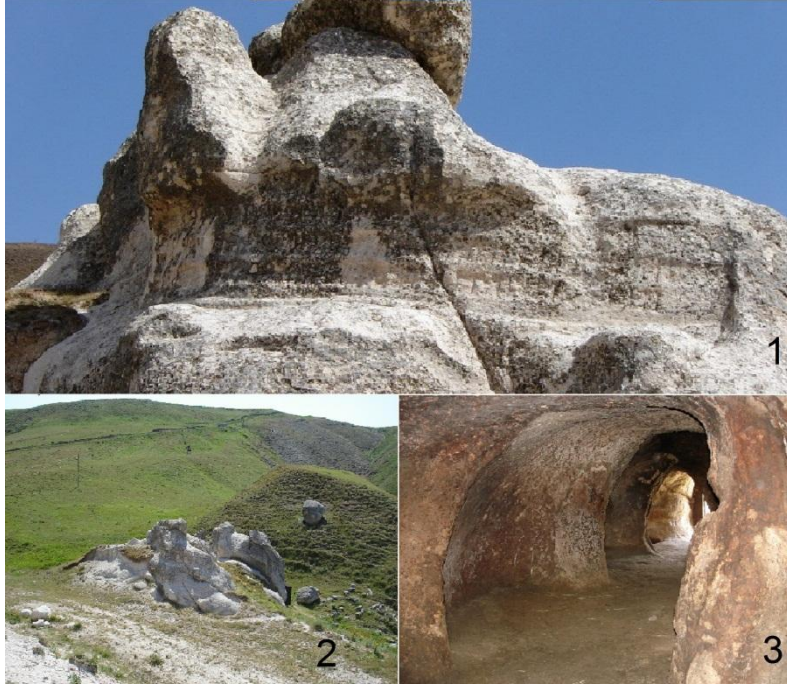
Şekil 5. Batabat kaya mezarı: 1-yazıt; 2-mezarın genel görünümü; 3-mezarın iç görünümü (Veli Bahşeliyev). Fig. 3. Batabat rock tomb: 1- cuneiform; 2- general view of burial; 3- interior of burial (Veli Bakhshaliyev).