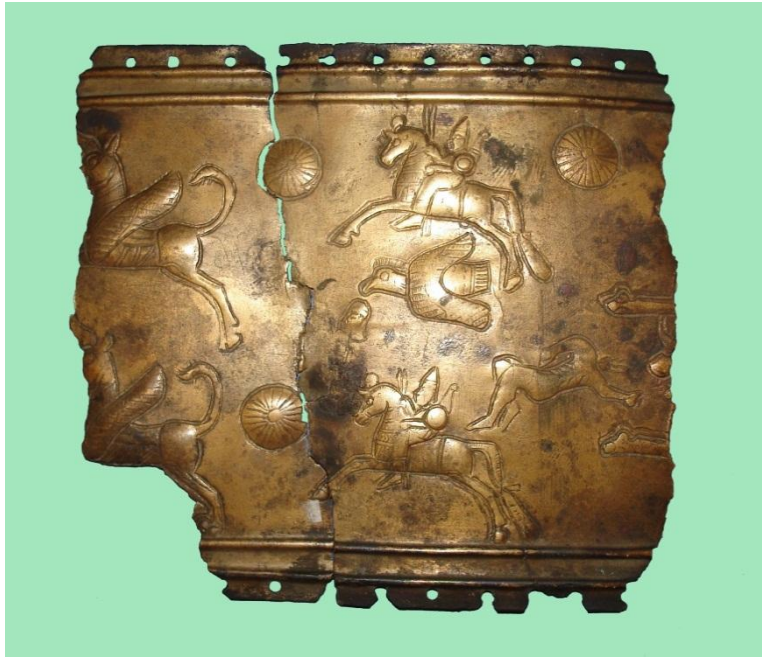
Şekil 2. Tunç kemer parçası (Veli Bahşeliyev). Fig. 2. Fragment of bronze belt (Veli Bakhshaliyev).