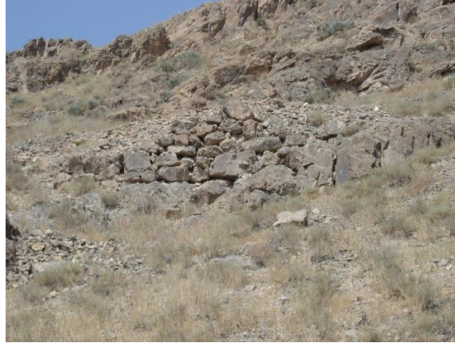
Şekil 10. Ferhad kanalının destek duvarları (Elmar Bahşeliyev). Fig.11. Wall of Ferhad canal (Elmar Bakhshaliyev).