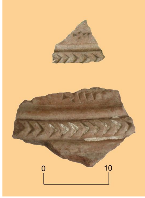
Şekil 9. Çivi yazıtlı seramikler (Veli Bahşeliyev). Fig. 10. Cuneiform-inscribed sherds (Veli Bakhshaliyev).