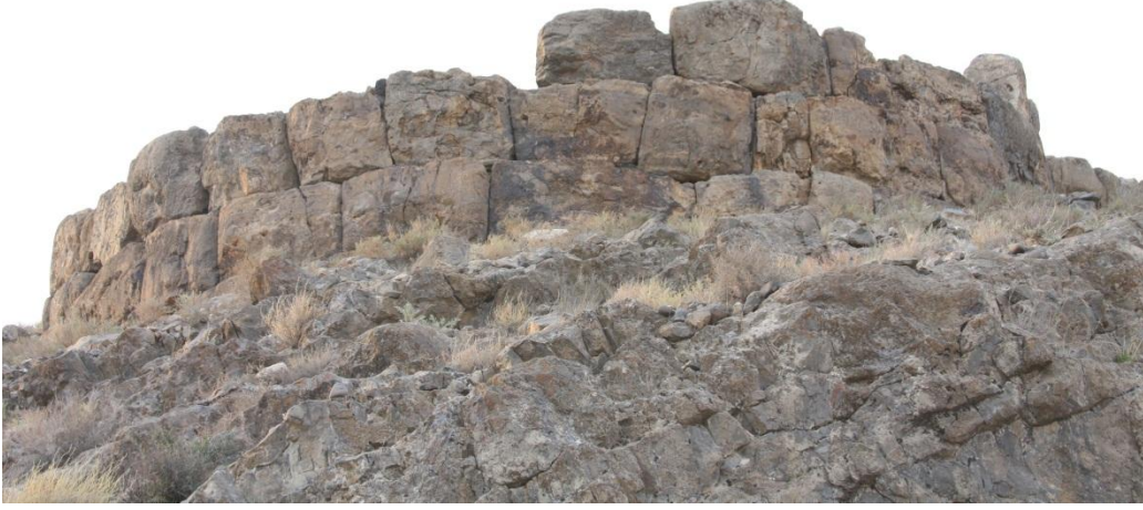
Şekil 7. Oglankale'nin kuzey kulesinin görünümü (Veli Bahşaliyev). Fig. 8. View of northern tower (Veli Bakhshaliyev).