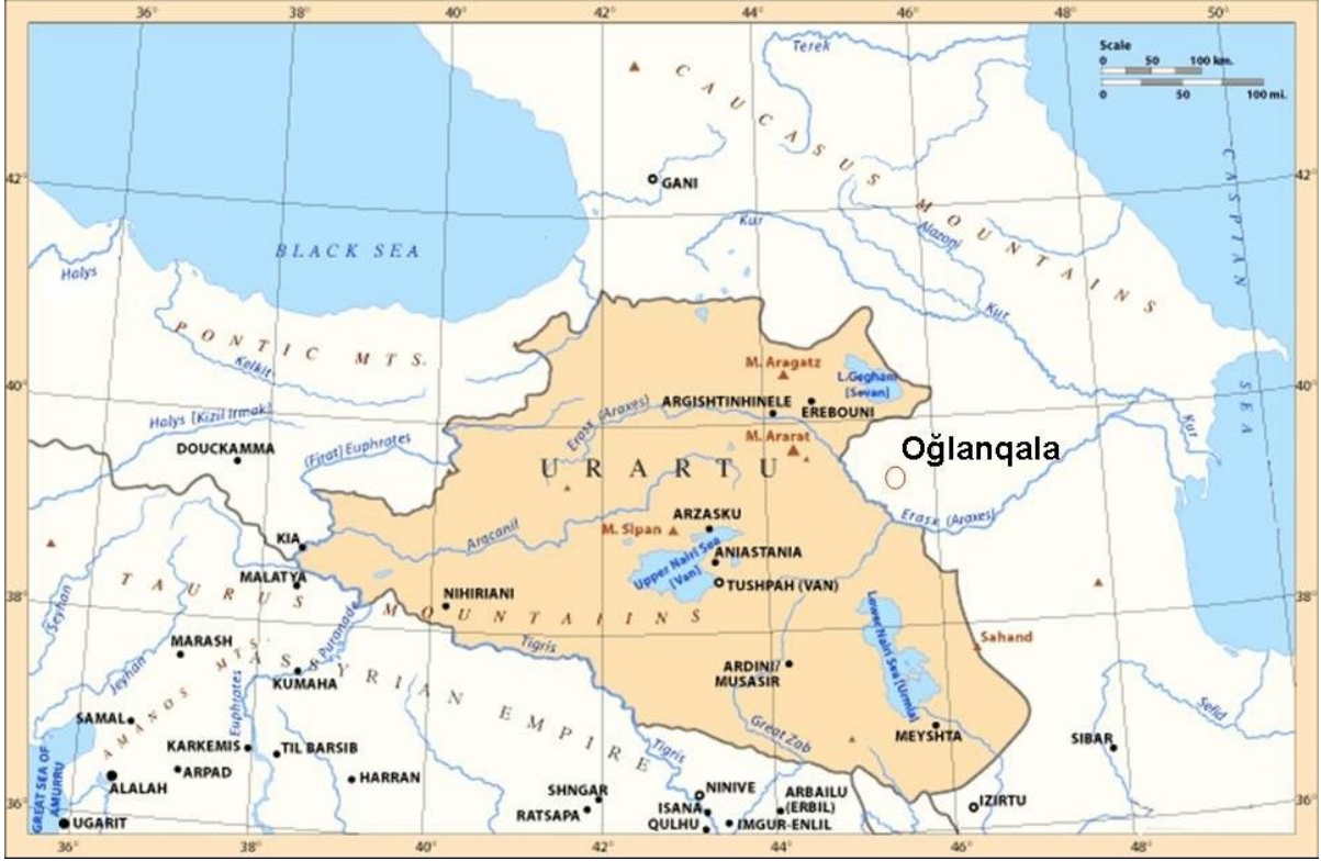
Şekil 1. Regionun haritası (Lauren Ristvet / Veli Bahşeliyev). Fig. 1. Regional map (Lauren Ristvet / Veli Bakhshaliyev).