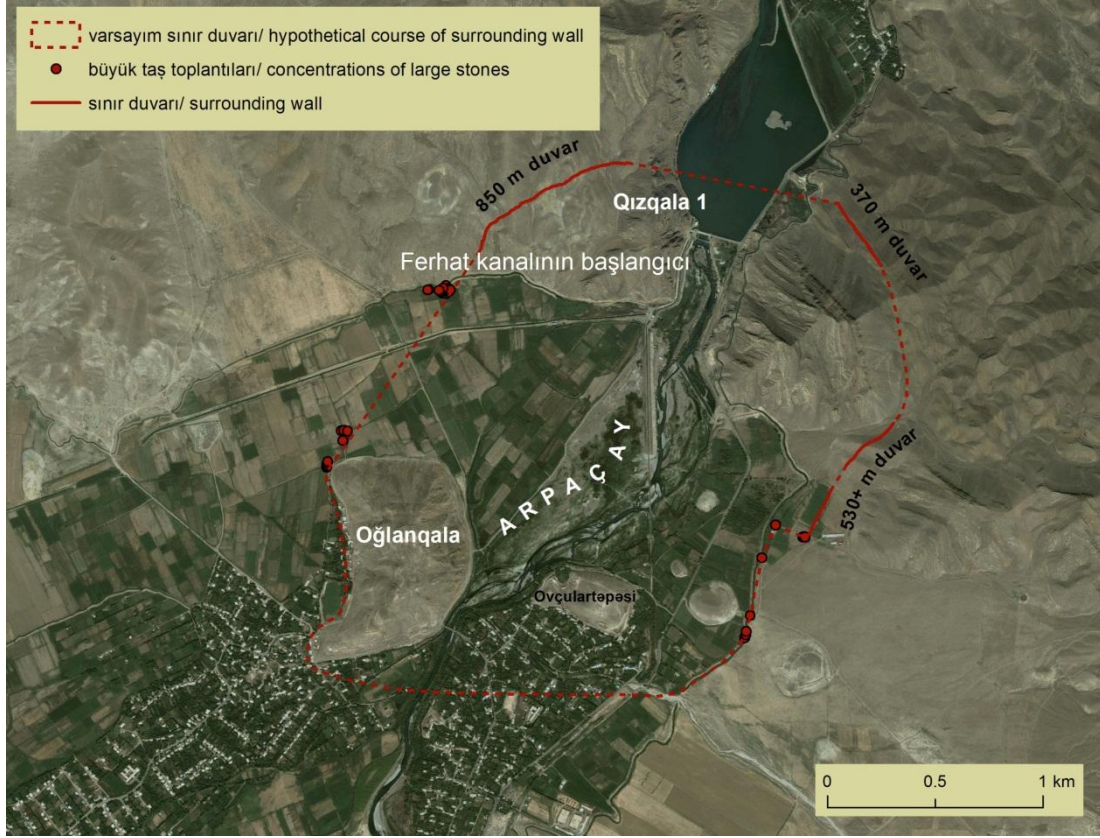
Şekil 11. Oğlankele ve Kızkale'yi çevreleyen savunma duvarı (Emily Hammer ABD). Fig. 12. Defensive wall, surrounding Oglankale and Kızkale (Emily Hammer USA).