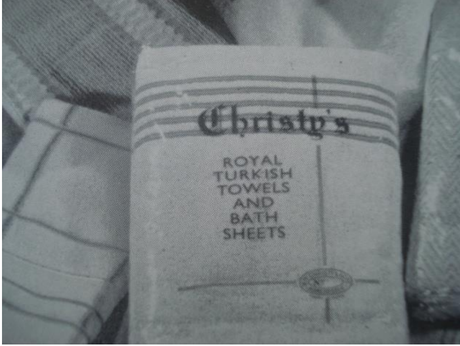
Resim 4: Christy’s de üretilen Türk Havlusu

Kraliçe Victoria ve Prens Albert sergi boyunca kendi armalarını taşıyan havlulara büyük ilgi göstermiştir. Osmanlı dokuması olan Türk havluları ilk uluslararası ödülünü Crystal Palace’daki sergide Christy and Sons şirketi adına almıştır.