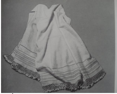
Resim 2:İngiltere’de ilk Türk Havlusu 1851yılı.