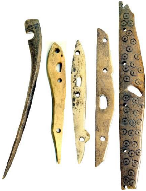
Resim 3: Okçu teçhizatından detaylar. Kemik. Bilyar Yerleşimi.

Kıpçakların tarihi süreçte Orta İdil bölgesindeki rolleri, Altınordu döneminde, İdil Bulgarları ve Aşağı İdil'in (Deşt-i Kıpçak) bozkır kavimleri Moğolların kurduğu devletin hâkimiyetine girince daha da artmıştır. Günümüz Tatarlarının maddi ve manevi kültürlerinin bu oluşuma katkıları arkeolojik buluntular açısından henüz yeterince araştırılmamıştır. Fakat yazılı ve dilsel kaynaklar, Altınordu dönemini Tatarların etnosunun ve kültürlerinin oluşumu açısından önemli bir etap olarak kabul eden tarihçiler grubunun görüşlerini desteklemektedir. Bu süreçlerde bize göre yabancı "Tatar" gruplar değil, Bulgar ve Kıpçak grupları lider konumdaydılar.