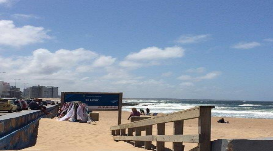
Uruguay'da bulunan Emir plajı