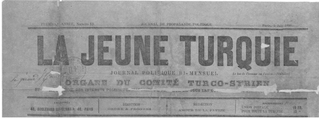
Fransa'da çıkartılan "Genç Türkiye" Gazetesi