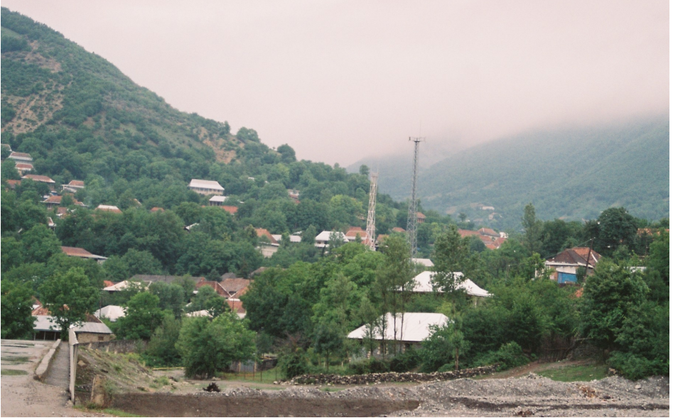
Şeki Bölgesi Kış Kasabası, 19.7.2007. Şeki Bölgesi Kış Kasabası "Alban Mabedi" Müzesi, 19.7.2007.