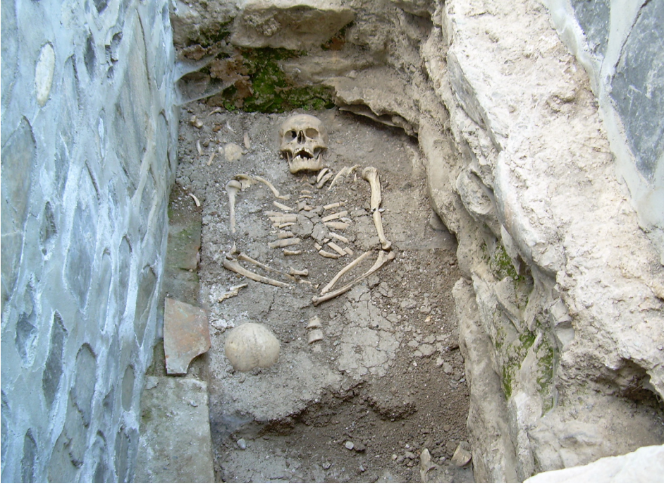
Alban Mabedi (Kilisesi) çevresinde bulunan ve üst üste defnedilmiş altı kişilik aile mezarları 19.7.2007.

Tur Heyerdal iki halk arasındaki kültürel ve tarihsel paylaşımları ve etnoğrafik benzerlikleri şu açıklamalarıyla dile getirmiştir.: "Hezer denizi sahillerinde (Gobustan-Arkeoloji Sahası) qayaüstü qayalar üzerindeki resmler mene Gırmızı deniz sahesinde rast geldiyim qedim Misirin qamışdan düzeldilmiş gemi resmlerini hatırlatdı. Bu ve diger yerlerde gemilerin ön hissese Güneş remzi vurulmuşdu. Bu resmler deqiqliyi ile vikinqlerin qedim gemilerini yada salırdı." (5).