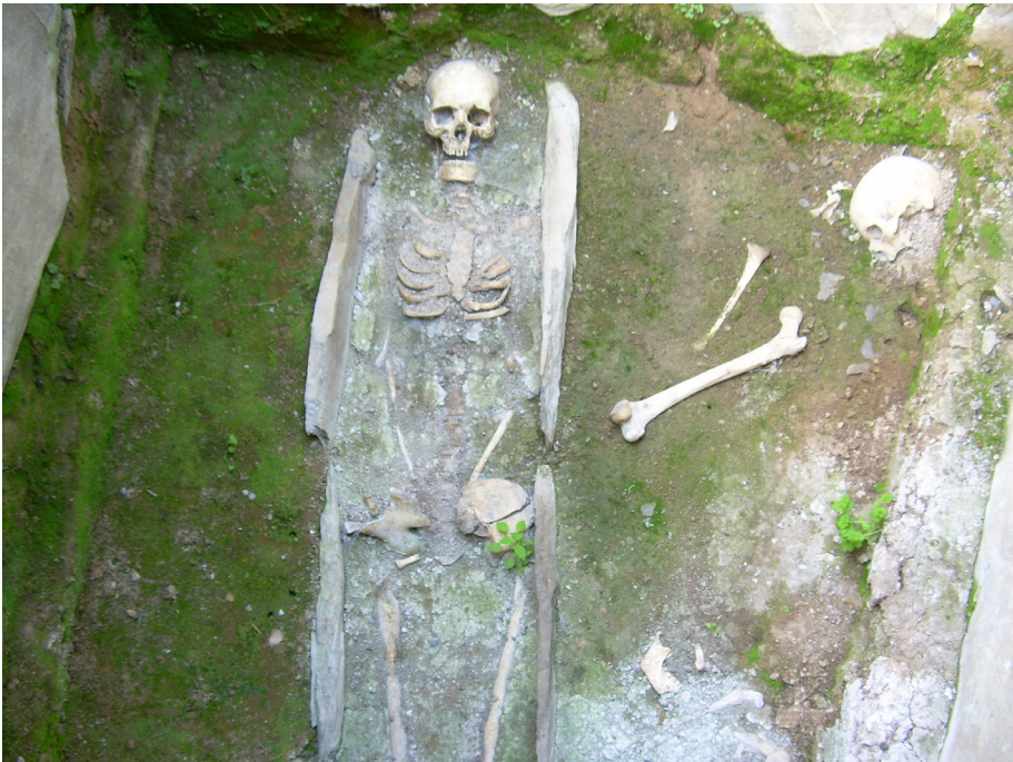
Alban Mabedi (Kilisesi) çevresinde bulunan 2.20 m. boyuna ve 35 yaşında öldüğü tespit edilen kadın ve diğer aile mensuplarının mezarı 19.7. 2007.