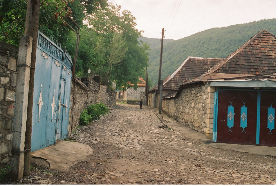
Şeki Bölgesi Kış Kasabası, 19.7.2007.