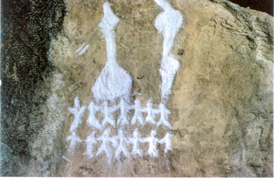
Gobustan Mağara Kazıları (Yalli dansı bu kazılardan esinlenmiştir.) (M.Ö IV.Y.Y) Foto: G. Aktaş, Ekim, 1990.